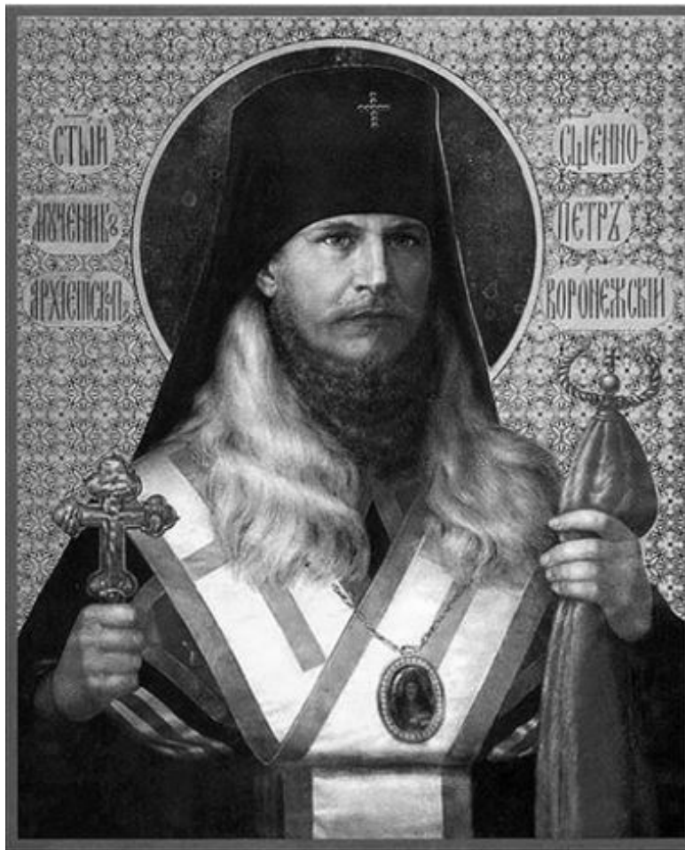
Икона священномученика Петра (Зверева).