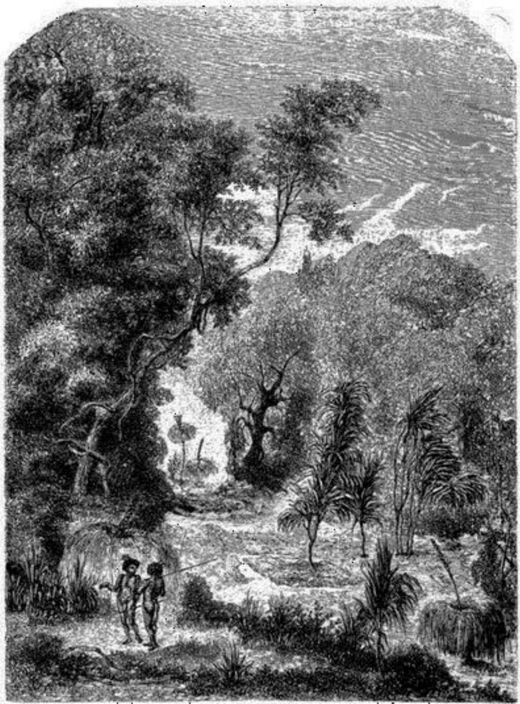
Sépultures australiennes dans les bois.—Dessin de Lancelot d'après Mitchell.

l'inclémence de l'air et les insultes des oiseaux de proie, jusqu'à ce que la décomposition cadavérique livre ces lamentables restes aux chiens sauvages, accourus à cette curée des quatre aires de l'horizon.