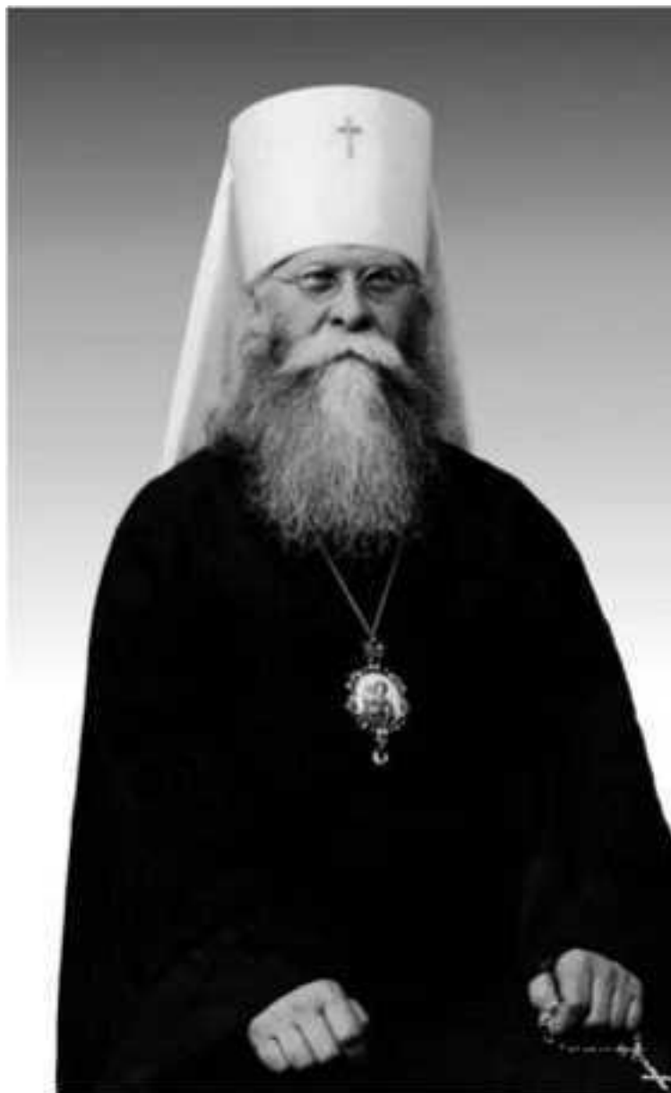
Митрополит Иосиф (Петровых). Конец 1920-х гг. (Из следственного дела 1937 г.)

Митрополит Иосиф принадлежит к тем ключевым фигурам в истории Русской Православной Церкви XX века, которые вызвали и вызывают немало споров. С его именем связано возникновение самого сильного церковного движения сопротивления богоборческой политике советских властей и компромиссному курсу соглашений части церковного руководства с правительством. В то же время не вызывает сомнений, что Владыка Иосиф был одним из самых выдающихся архиереев 1920-1930-х гг., горячим молитвенником, опытным иноком, аскетом, крупным богословом. В 1981 г. Архиерейский Собор Русской Православной Церкви за границей причислил митрополита к лику святых среди новомучеников и исповедников российских. Уже несколько лет обсуждается и вопрос его возможной канонизации и Московской Патриархией.