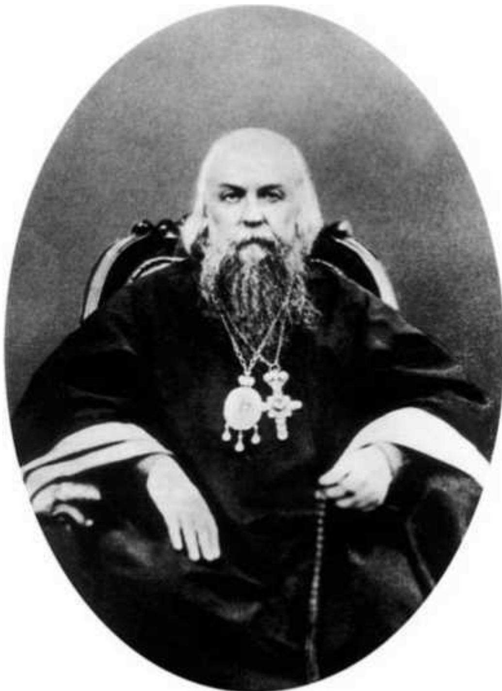
Святитель Игнатий Брянчанинов

Итак, по слову богоносного святителя Игнатия, мятежи есть последний признак начальных болезней человечества, которые предшествуют болезни окончательной – антихристу.