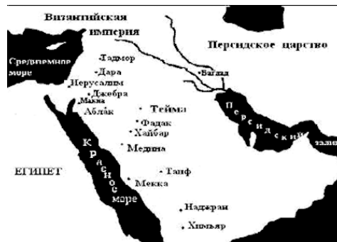
Илл.2. Карта расположения городов с еврейским населением на Аравийском полуострове (Хиджаз) в VII веке н. э.

охватывают только Иорданию, и Палестину в Аль-Шаме, и области Ятриб (Ясриб) и Хайбар в Хиджазе, как хорошо известно». 2