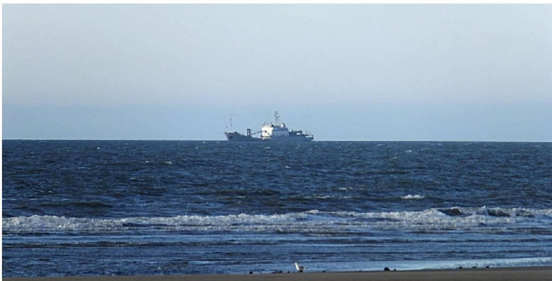
Судно в районе полуострова Канин.

Со временем увеличивалось число переселенцев на берегах Белого моря. Предприимчивых промысловиков тянуло дальше на Север и на восток, в Сибирь. Людей манили огромные прибыли, которые они получали от таких поездок.