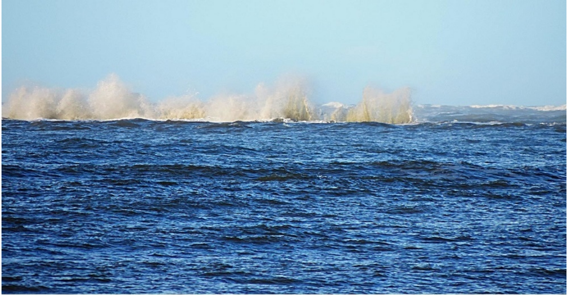
Море у Канина бывает и таким.

Поморам же было недосуг до этих научных премудростей, и они зачастую объясняли все это просто: тут живет некое мифическое существо – червь, грызущий борта судов. По преданиям, именно он не пускает мореплавателей за пределы Белого моря, утаскивает корабли в пучину или разбивает их о скалы. Справедливости ради надо сказать, что в природе такой червь-древоточец есть; это – широкораспространённый во всем Северном полушарии корабельный червь, или шашень, настоящий бич морских держав, уничтоживший несметное множество деревянных судов во всем мире. Видимо, именно его имели в виду поморы, но они наделяли червя поистине мистическими свойствами.