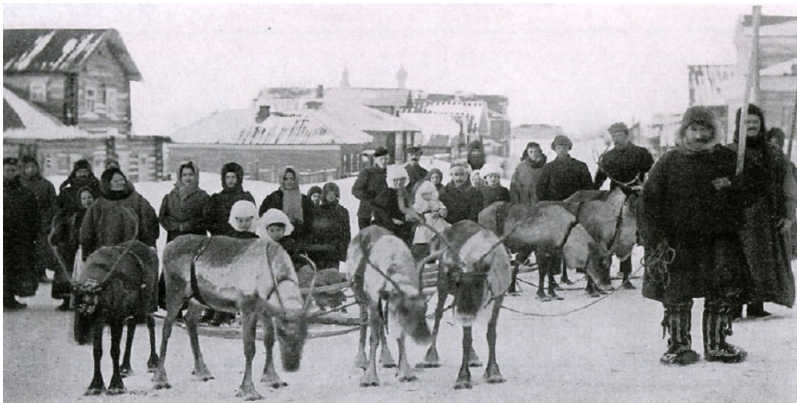
Мезень. Конец 19 века.

Итак, встретились два народа славяне и ненцы. Встреча двух народов произошла на территории нынешних Мезенского и Пинежского районов, полуострове Канин, где они живут, и по сей день.