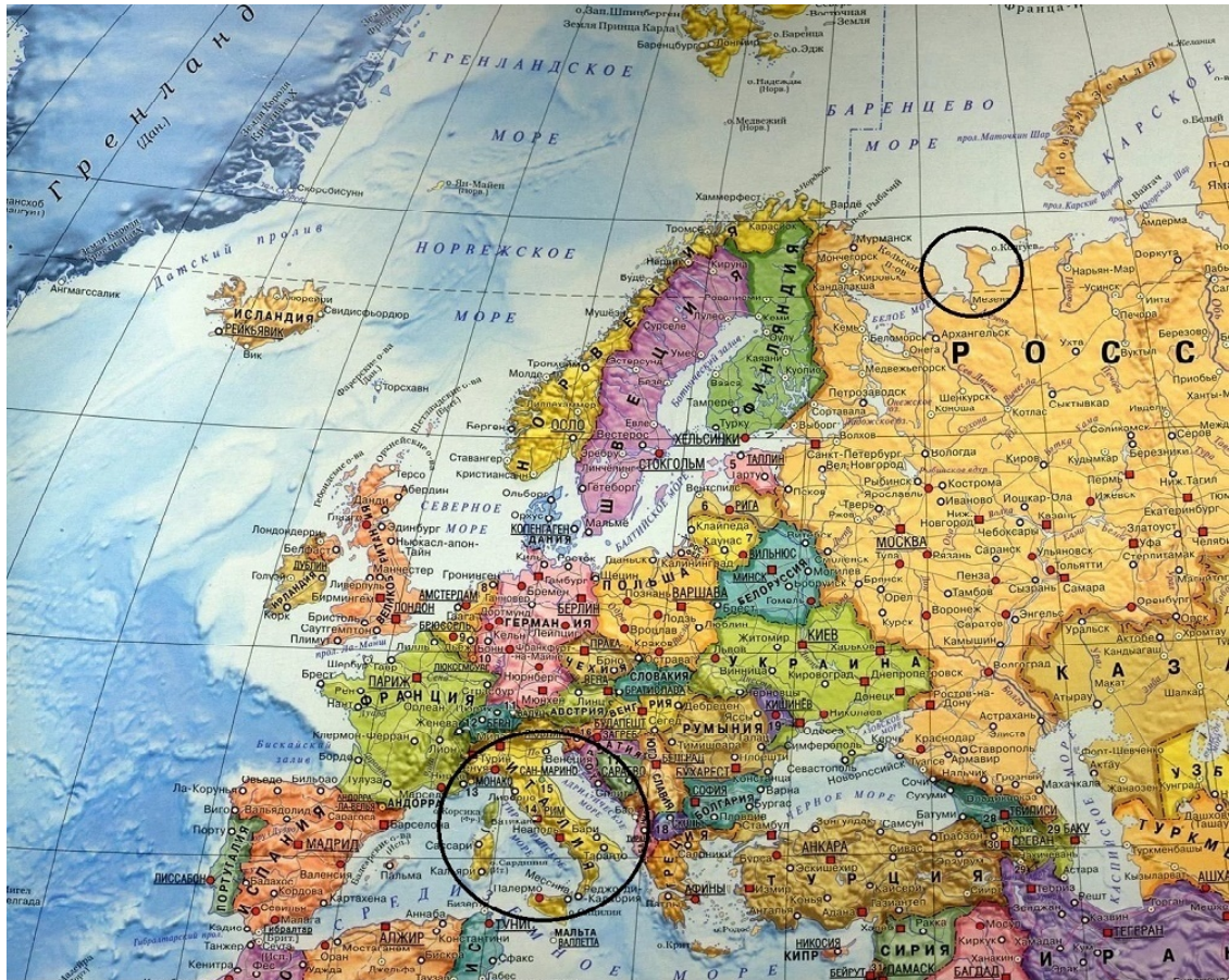
Два полуострова "сапога"- Канин и Апеннинский.