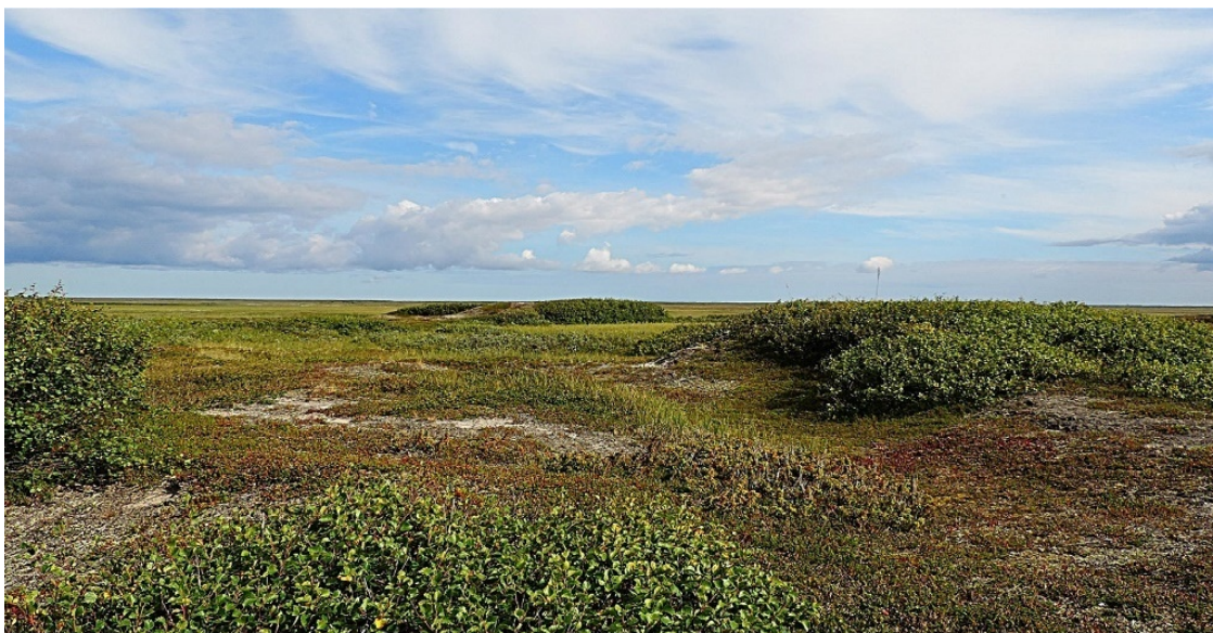
В Канинской тундре.

Канинской тундрой обычно называют тундру Канина полуострова. Край богатый рыбными запасами, птицей и зверем. Канинскую тундру очень красит близость морей. Особенно хороша северная её часть, куда и уходят на летние месяцы оленеводы со своими стадами.