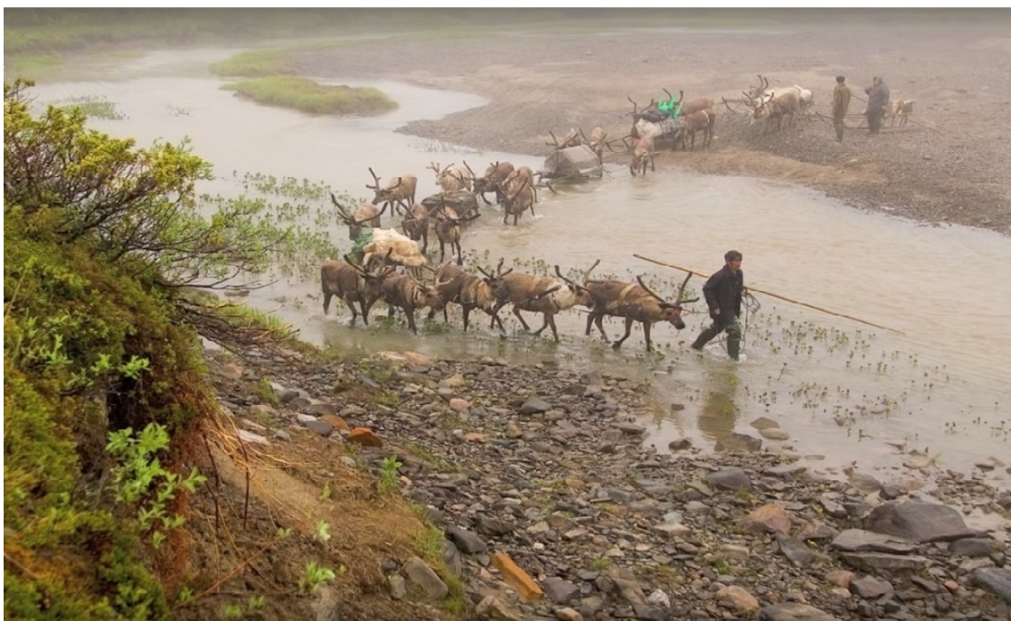
Канинские ненцы.

Следует помнить, что к тому времени на Мезенских и Канинских землях уже обосновались одни пришельцы – это ненцы. Ещё до появления первых оседлых поселений славян на нижней Мезени возник очаг торговли между приезжими торговцами и кочующими ненцами.