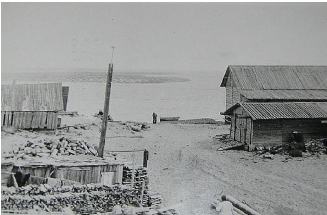
Шойна. Посёлок на Канине

Поморы – это потомки древних русских поселенцев, преимущественно из Новгородской земли. Они заселяли территорию юго-западного и юго-восточного побережья Белого моря в XII – XVIII веках. Издавна эти люди занимались рыболовством, торговым мореплаванием и судостроением.