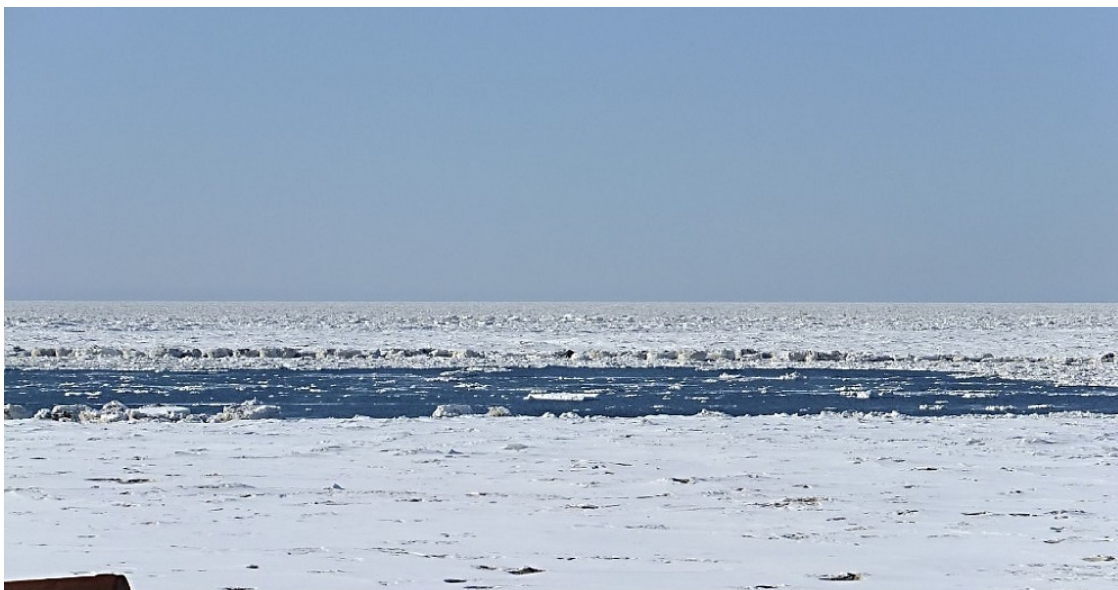
Льды у Канина.

До середины лета на выходе из Белого моря непреодолимым валом лежали льды. Они, как мощные жернова, постоянно крутились в узком Горле, перемалывая все и вся. Беда была, если суда оказывались среди этих ледяных жерновов.