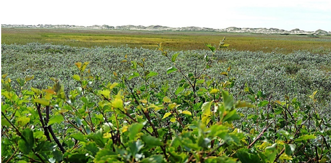
Канинская земля.

Право ненцев на владение Канинскими землями было закреплено жалованной грамотой царя Ивана Грозного ещё в 1545 году.