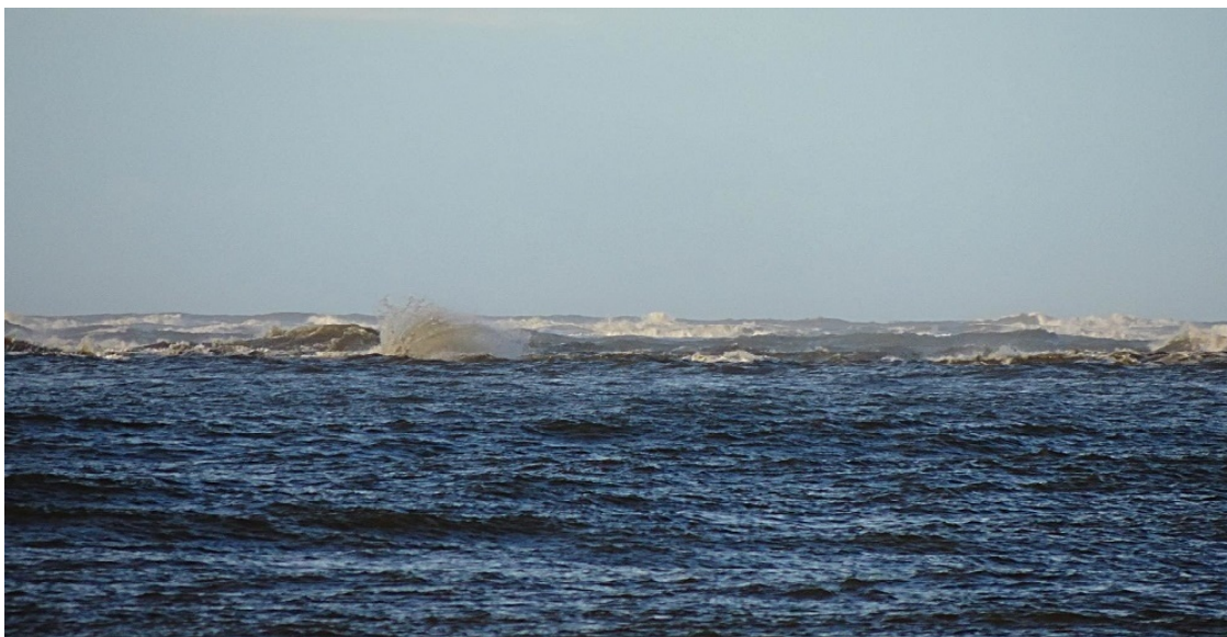
Белое море в районе Канина.

"Русский Север всегда стоял лицом к морю, и русский помор не мыслил себе жизнь без моря. Море накладывало зримый и незримый отпечаток на хозяйственный и бытовой уклад значительной части населения всего региона.