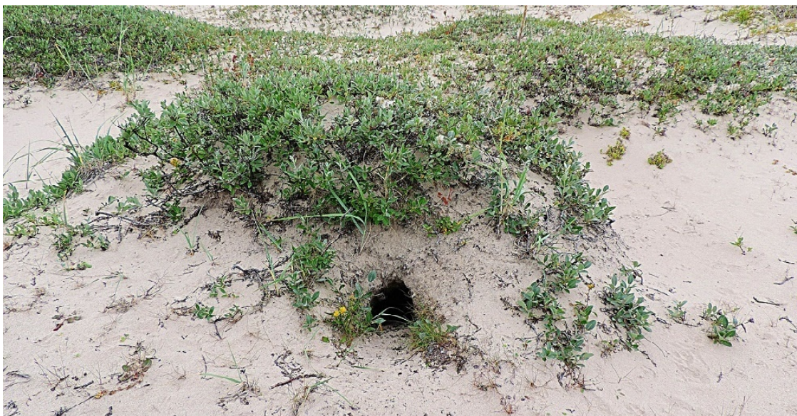
Странное углубление в песчаной сопке.

На поверхность тундры они выходили по ночам или в туман. Сихиртя считались умелыми кузнецами, хорошими воинами.