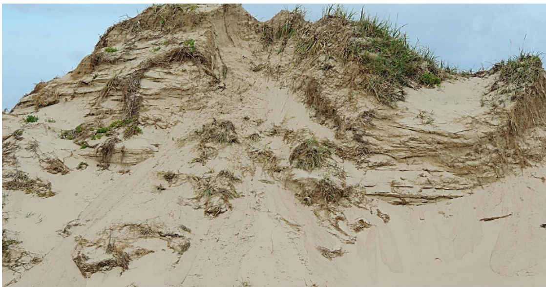
Песчаная сопка.

Если задать вопрос любому грамотному человеку сегодня: «Кто аборигены на Крайнем Севере нашей страны?», то ответ видимо должен быть однозначным – «Ненцы».