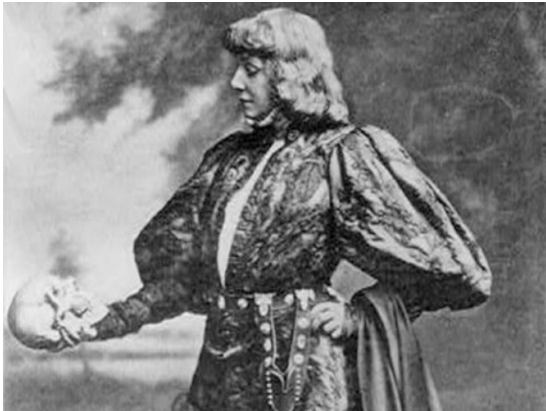
Сара Бернар в роли Гамлета