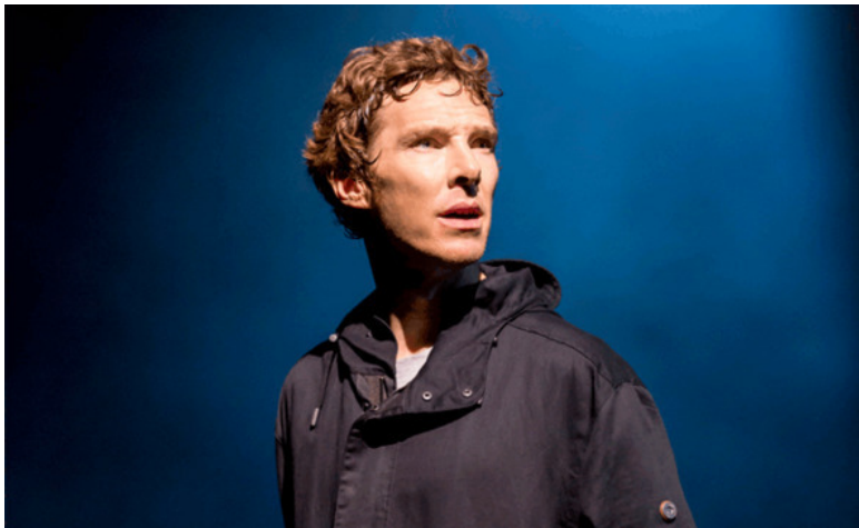
Бенедикт Камбербэтч в роли Гамлета