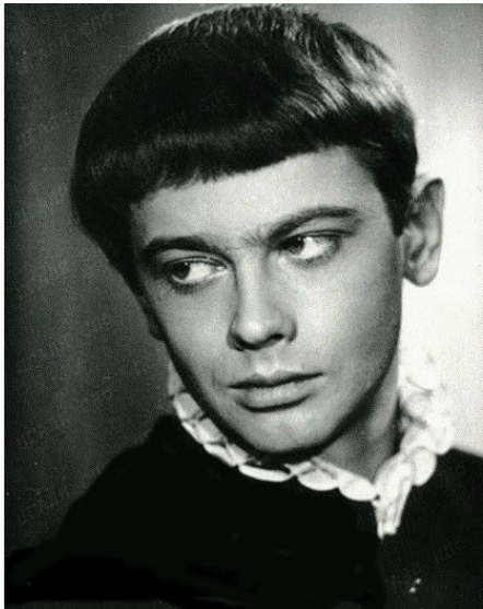
Александр Демьяненко на пробах роли Гамлета