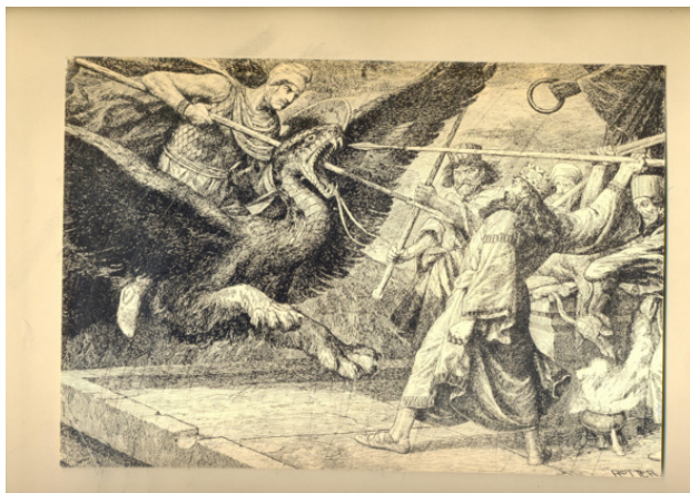
Рис. 1. Сон Аждахака, Роттер 1939

Интересна литогравиюра «Сон Аждахака» немецкого художника Роттера 1939 г. издания «Из древнеармянских легенд и преданий» 1 .