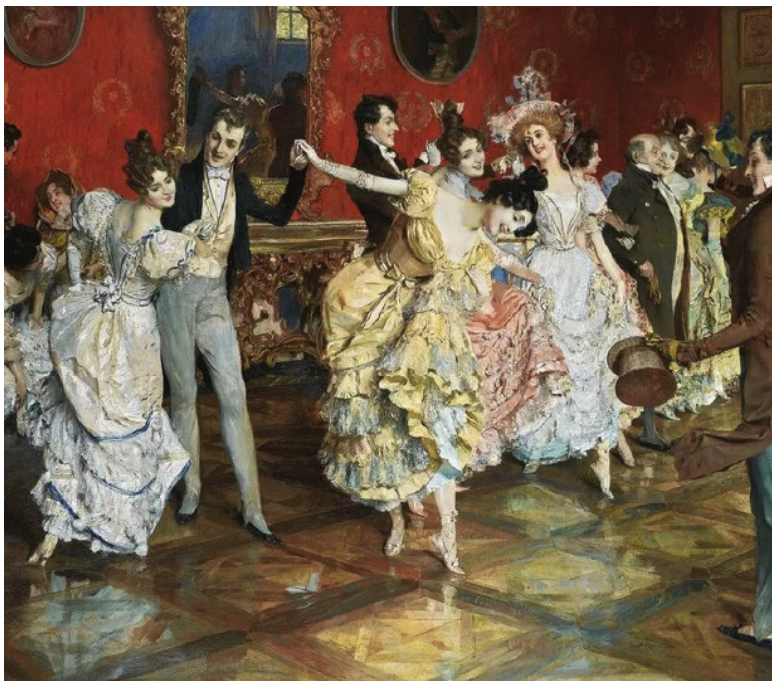
На балу. Фрагмент. Леопольд Шмутцлер.

Всё упомянутое здесь, безусловно, не является исчерпывающей «картиной мира», которую увидел юный Пушкин на заре своей недолгой творческой жизни. Любую реальность очень сложно представить в виде безупречной схемы, она всегда полна разных нестыковок и противоречий – иначе не было бы никакого развития, и одна эпоха бы не сменяла другую. А правдивое изображение русской действительности во