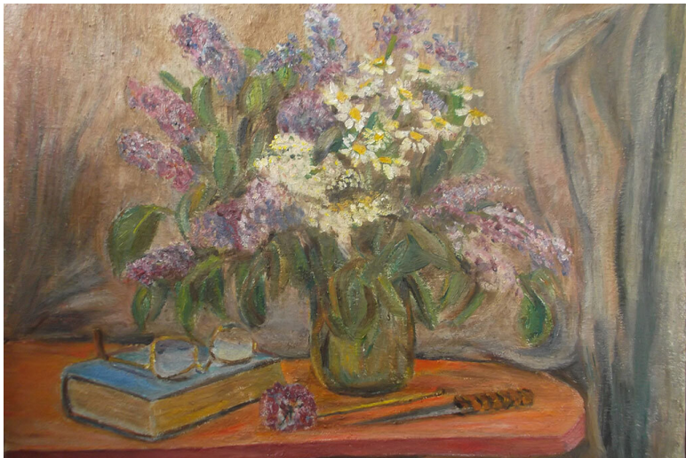
Натюрморт «Вот так и живём»