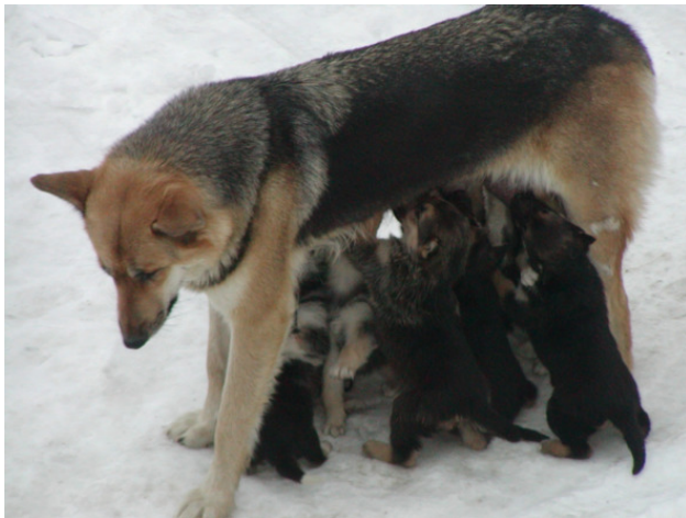
Та самая Найда

В Туре, как и в любом северном поселке с большим количеством охотников, полно бродячих собак, и как с ними не борются местные власти, поголовье их не уменьшается. За десятилетия этой борьбы «кучумы», «таймыры», «валеты» и прочие «бобики» выработали определённую тактику выживания в период антисобачьих кампаний.