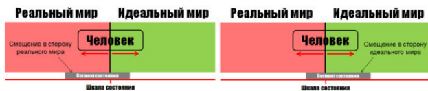
Рисунок 2 – Приоритеты сегмента состояния: слева – сегмент состояния с реальным приоритетом; справа – сегмент

Итак, в зависимости от установленных границ, сегмент состояния может быть уже или шире. При этом большая часть сегмента, как правило, располагается в одном из миров. В этом случае говорят о приоритете сегмента состояния и о смещении приоритета. Например, если большая часть сегмента расположена в реальном мире, то мы говорим о том, что приоритет сегмента смещён в сторону реального мира. Такой сегмент состояния называется сегментом с реальным приоритетом. В противном случае речь будет идти о сегменте с идеальным приоритетом (см. рисунок 2).