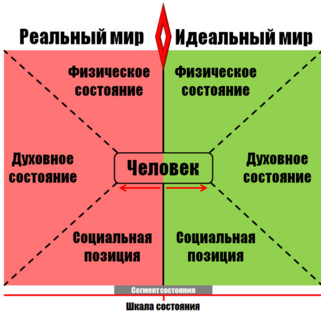
Рисунок 1 – Обобщённая модель мира и существования человека

Итак, мы выяснили, что каждый человек существует (пробывает) в двух мирах: реальном и идеальном. Соответственно, каждая из трёх составляющих человеческого существования имеет две вариации – реальную и идеальную. Для наглядности приведём несколько примеров. Допустим, речь идёт о физическом состоянии человека. В реальном мире человек может иметь избыточный вес, слабые руки, большое сердце. В то же время, в идеальном мире этого человека он