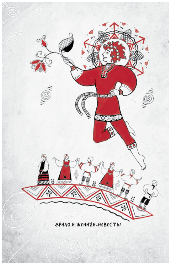
АРИЛО И ЖЕНИХИ-НЕВЕСТЫ

Он растеряется, отвык парень уже, чтобы девки на шею вешались, ветку возьмёт и глянет на тебя. А как глянет, так и присохнет. Но ты тут же повернись и прочь иди.