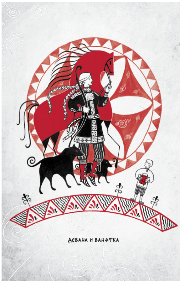
ДЕВАНА И ВАНАТКА

Оробел парнишка, аж голос потерял, но во все глаза смотрит, не налюбуется красотой неопикуемой. А Деване смешно стало.