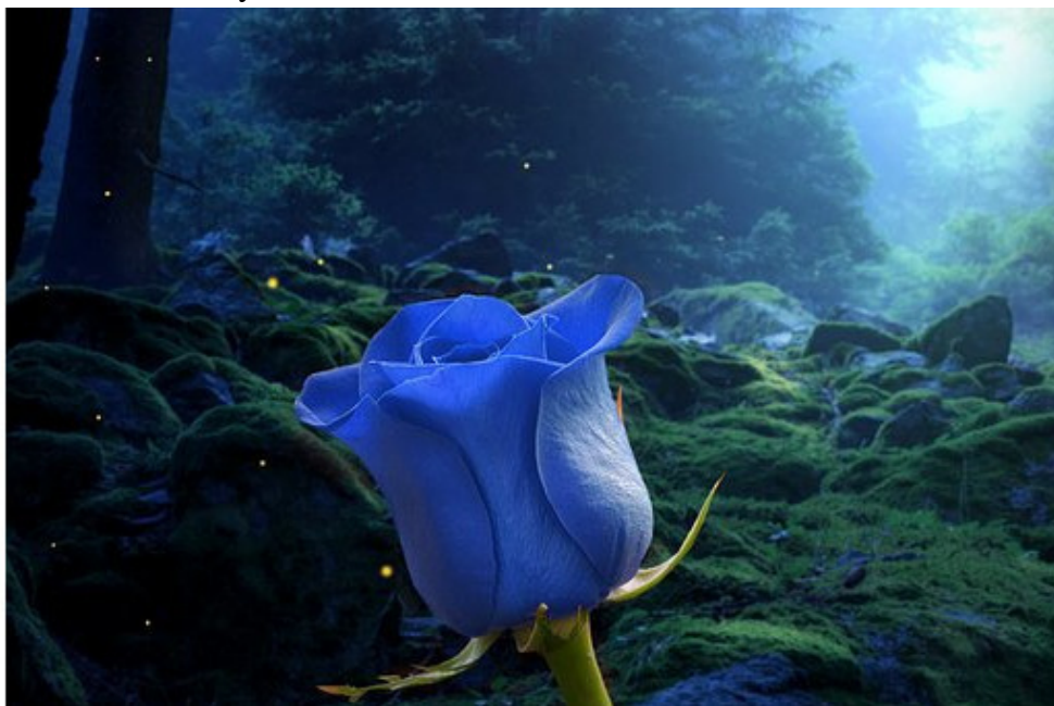
Рис. 1. Она в жизни была, как этот прекрасный и беззащитный цветок! И пусть издание этой книги будет, как цветы на ее могилу! И да успокоится ее душа! Аминь.

Создано в интеллектуальной издательской системе Ridero