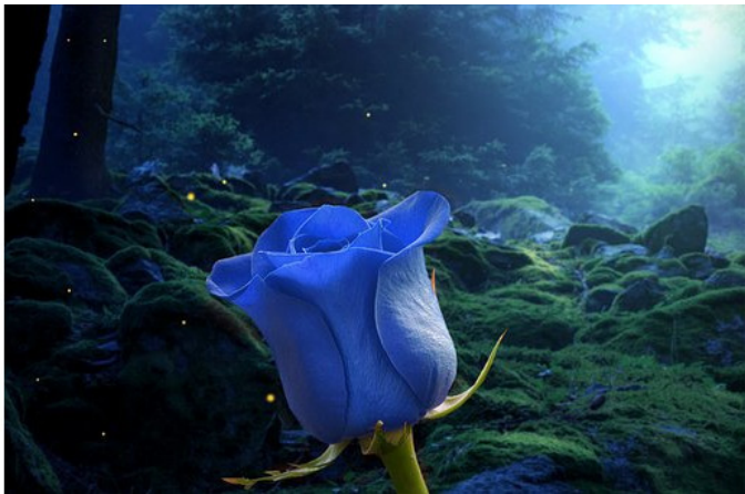
Рис. 1. Она в жизни была, как этот прекрасный и незащищенный цветок! И пусть издание этой книги будет, как цветы на ее могилу! И да успокоится ее душа! Аминь.