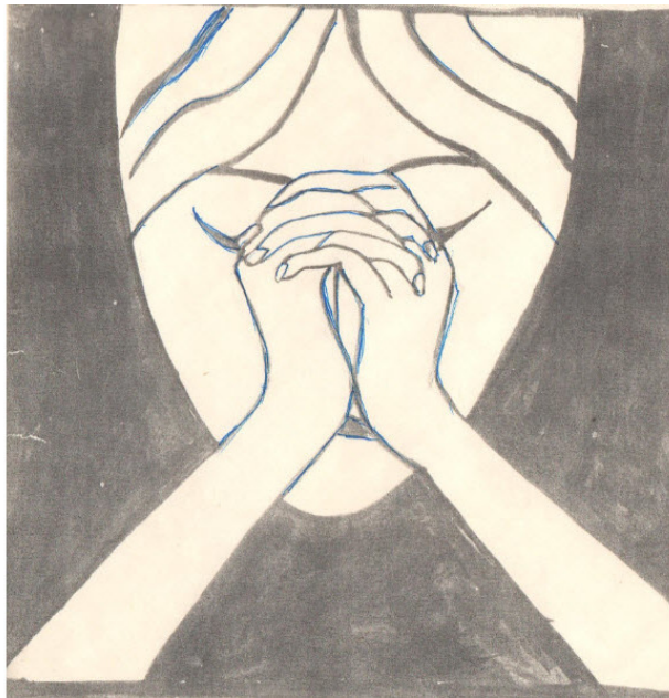
Рис. 3. И грустно...