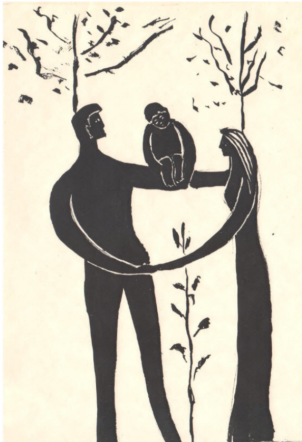
Рис. 4. Радость семьи.