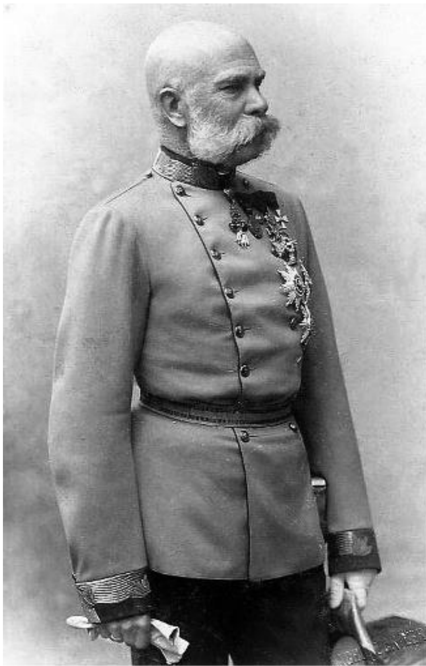
Император Франц Иосиф

Тот факт, что императоры Австрии и России не желали войны между своими странами, подтверждал, между прочим, не кто иной, как В.И. Ленин. Он писал Горькому на Капри в 1913 году: «Война Австрии с Россией была бы очень полезной для революции (во всей восточной Европе) штукой, но мало вероятия, чтобы Франц Иозеф и Николаша доставили нам сие удовольствие».