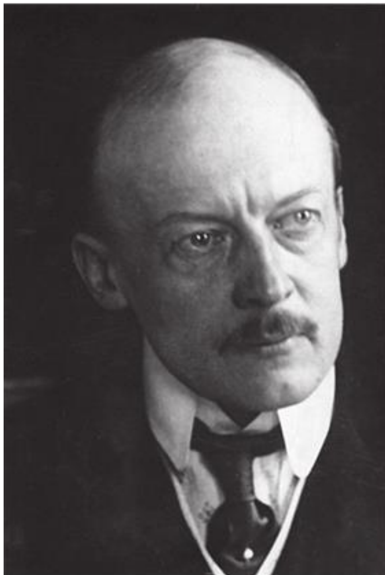
Граф Леопольд Берхтольд министр иностранных дел Австро-Венгрии