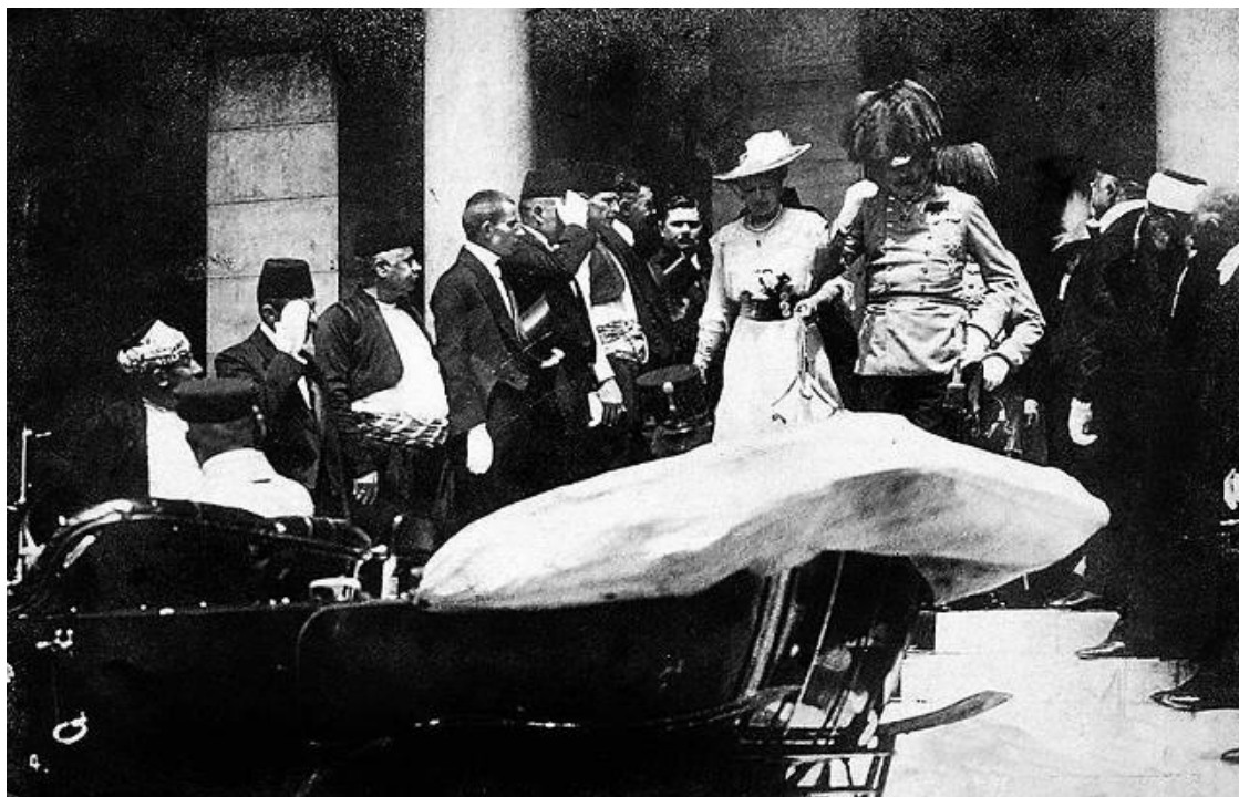
Эрцгерцог Франц Фердинанд с супругой в Сараево

Через несколько минут после того как заговорщики заняли свои места, показался кортеж. Он двигался медленно, со скоростью примерно 15–20 километров в час, и с дистанцией между машинами метров 30. Когда третья машина кортежа с черно-желтым императорским флажком проезжала мимо Мехметбашича, у того сдали нервы и он не решился действовать, также не смог посягнуть на жизнь человека и Чубрилович.