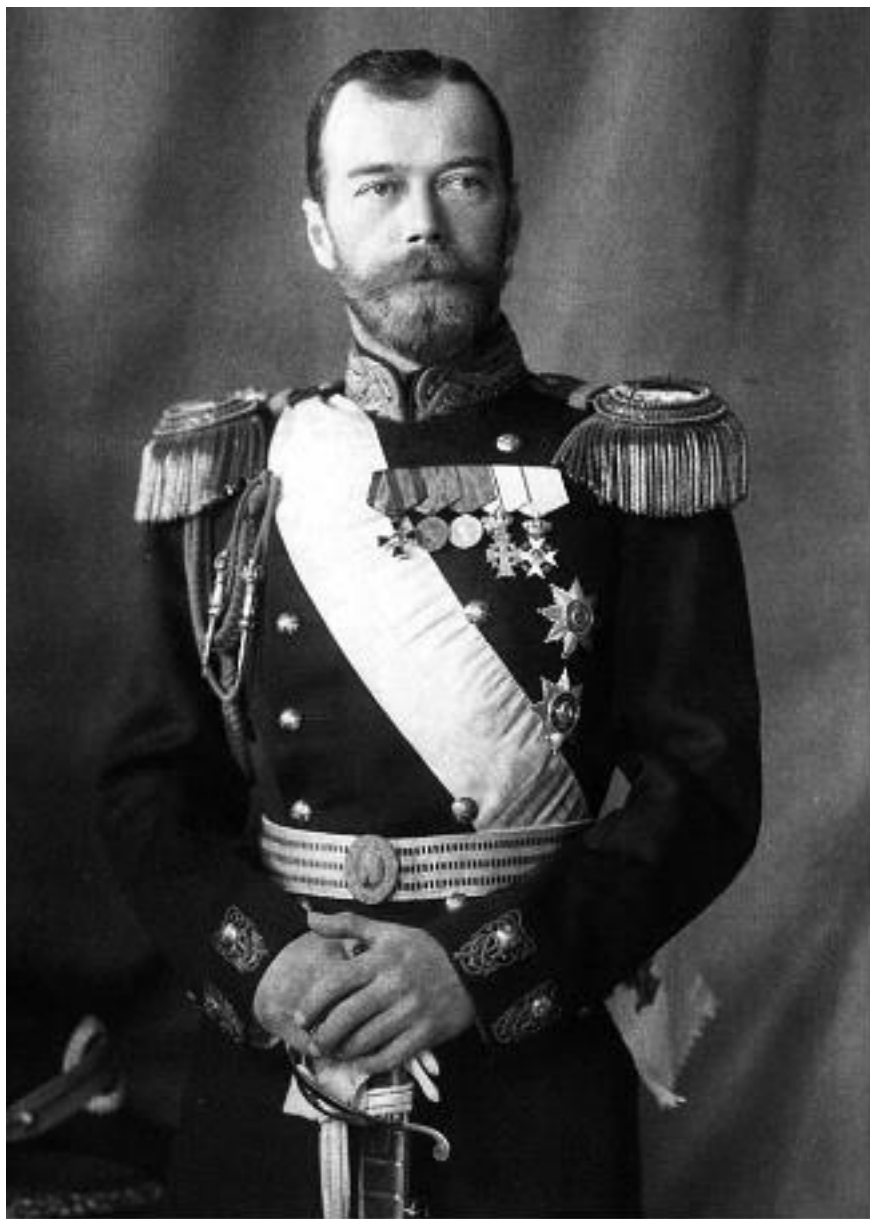
Император Николай II