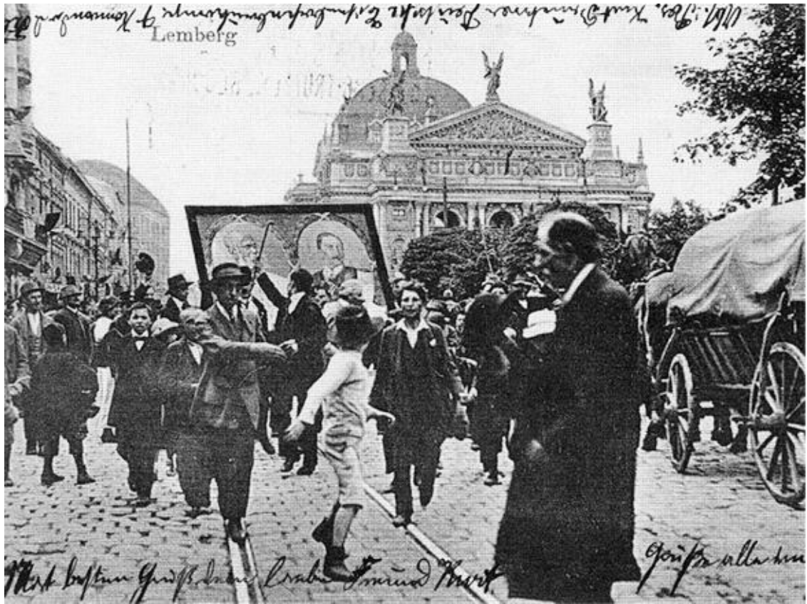
Демонстрация во Львове по поводу объявления войны

русского народа, и созданного ему в противовес движения украинского (украинофильского), приверженцы которого, в полном согласии с австро-польскими властями Галиции, стремились внушить русинам, что они, вместе с российскими малороссами, принадлежат к совершенно отдельному, не русскому, а “украинскому” народу.