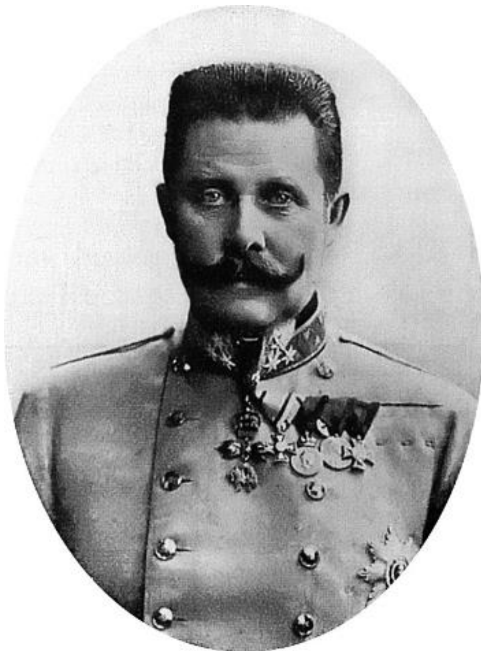
Эрцгерцог Франц Фердинанд

Хотя между Германией и Россией не существовало непреодолимых противоречий, для разрешения которых непременно требовалось бы воевать (на что в свое время указывал и О. Бисмарк), и стремление Германии к переделу мира, в котором доминировали Англия и Франция, вело Германию к столкновению именно с этими странами, но Россия наряду с Англией и Францией была членом Антанты, что вынуждало Германию смотреть на Россию как на своего неприятеля.