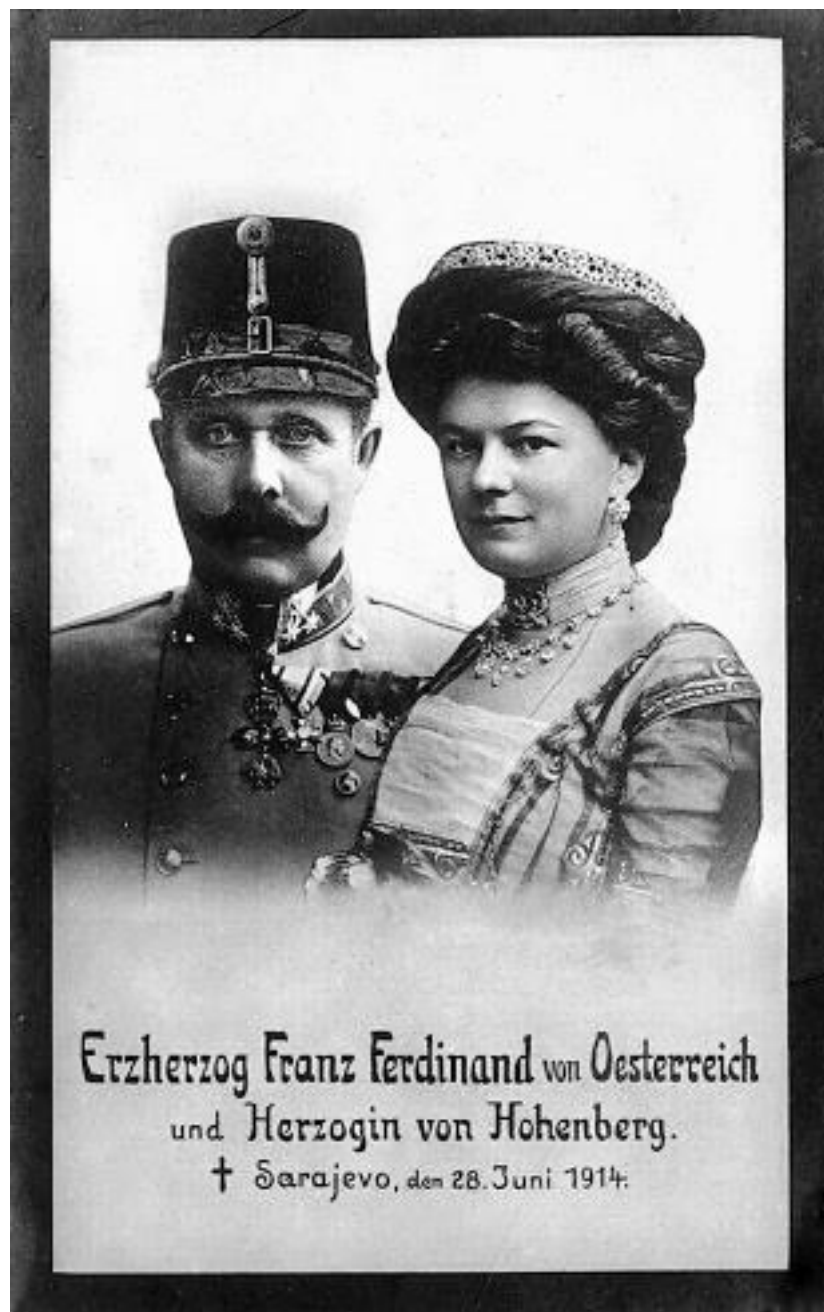
Эрцгерцог Франц Фердинанд и герцогиня Гогенберг