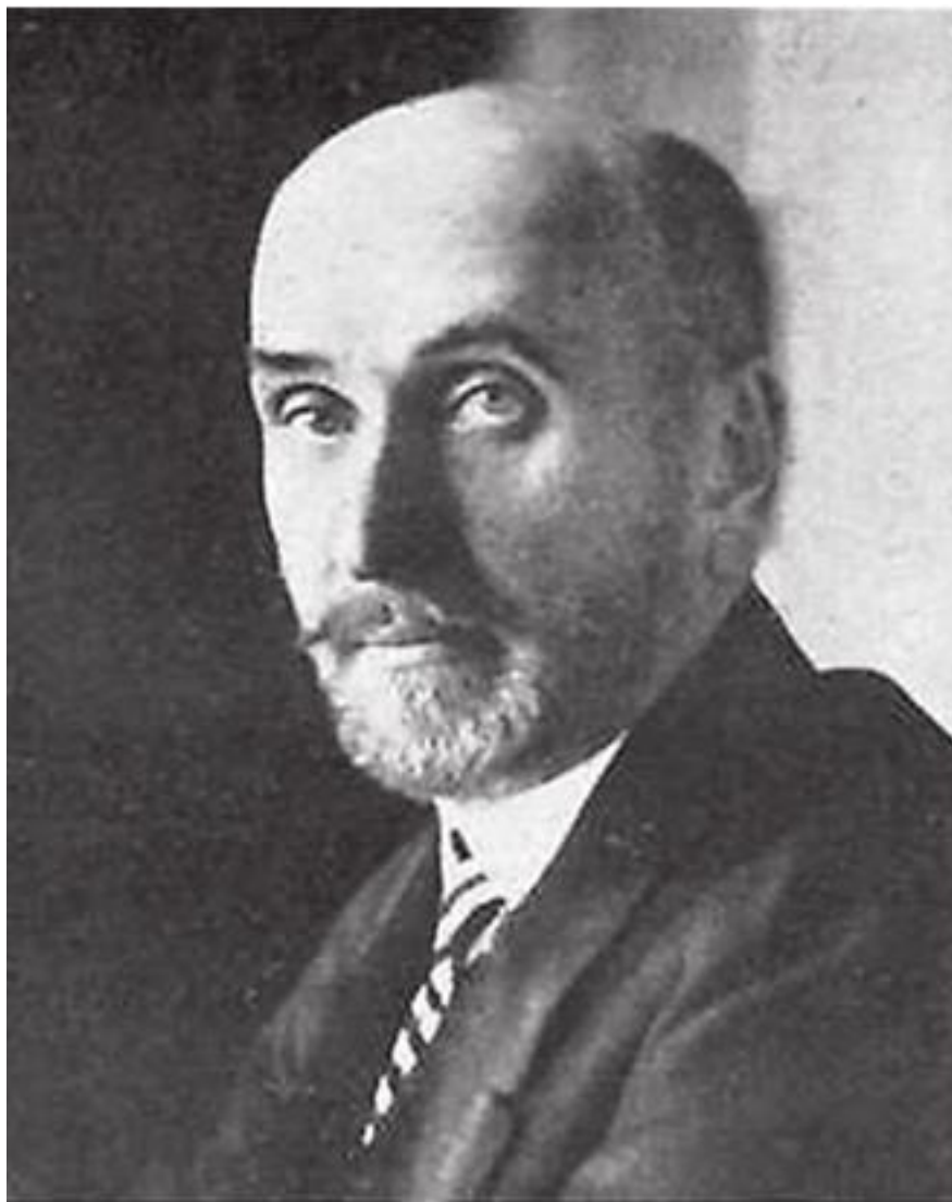
Сергей Дмитриевич Сазонов министр иностранных дел России

Осуществив в 1908 году аннексию Боснии и Герцеговины, Австро-Венгрия нанесла чувствительный удар по международному престижу России. Тогда говорили, что для России это была “дипломатическая Цусима”. Теперь, в июле 1914-го, так же как в Вене считали, что, оставив без последствий сараевское убийство, Австро-Венгрия потеряет свой авторитет на Балканах и подорвет свое положение как великой державы, точно так же в Петербурге, исходя из совершенно аналогичных соображений, не могли допустить разгрома Сербии.