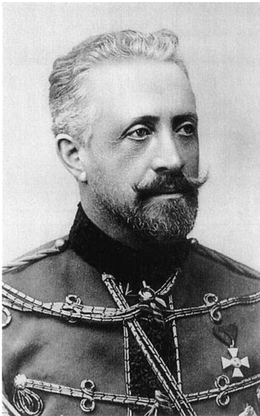
Великий князь Николай Николаевич Верховный главнокомандующий русской армии