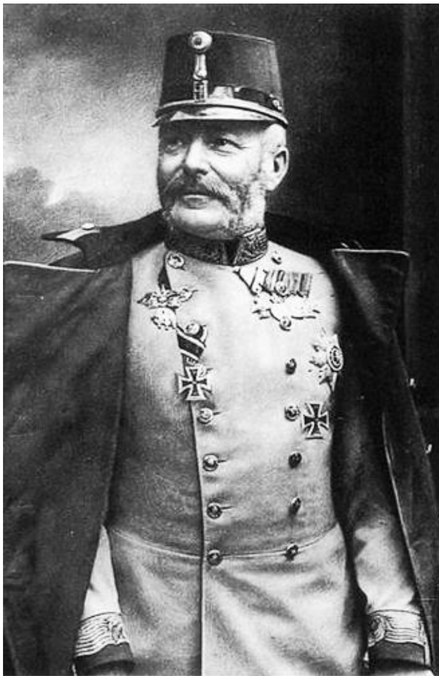
Эрцгерцог Фридрих Верховный главнокомандующий австро-венгерской армии

Непримиримая вражда сторонников украинского движения в Галиции к своим же братьям-галичанам, не желавшим в угоду властям отречься от идеи русского единства, постоянно проявлялась в злобных нападках, в призывах «завесить кацапское стерво на сухих вербах», в доносах и обвинениях в государственной измене, которые публиковались в прессе и звучали в выступлениях украинских депутатов. На протяжении последних предвоенных лет клевета и доноительство стали особенно широко использоваться галицкими украинофилами в борьбе против русского национального движения в Галиции.