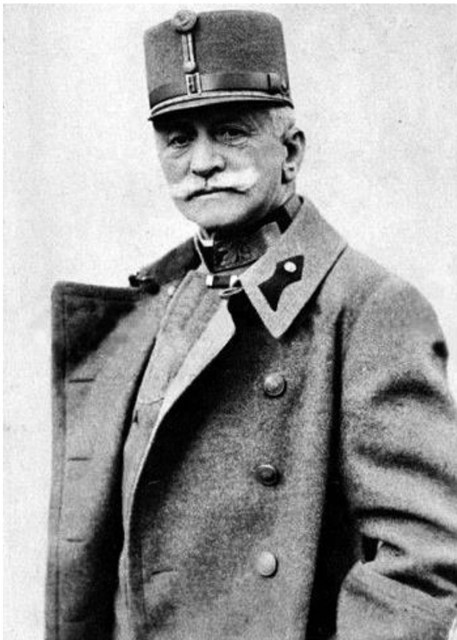
Франц Конрад фон Гетцендорф начальник австро-венгерского Генерального штаба