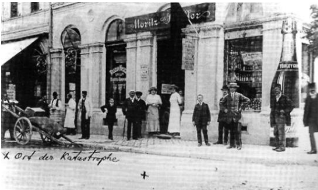
Сараево. Место покушения