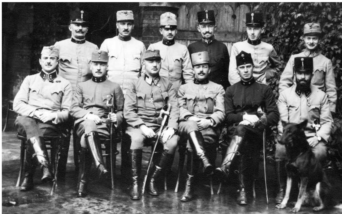
Группа офицеров австро-венгерской армии

Для того чтобы выявление и задержание “врагов” происходило более активно, власти на местах устанавливали за эту деятельность денежное вознаграждение. Так, например, в начале мобилизации военным комендантом города Самбора было издано на польском и украинском языках “Воззвание к полякам, украинцам и евреям”, расклеенное как в самом городе, так и в населенных пунктах Самборского повета. В воззвании говорилось: