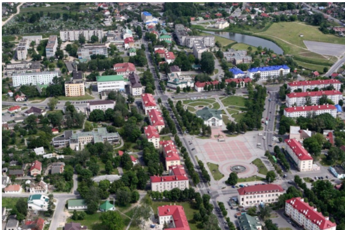
Волковыск сегодня.