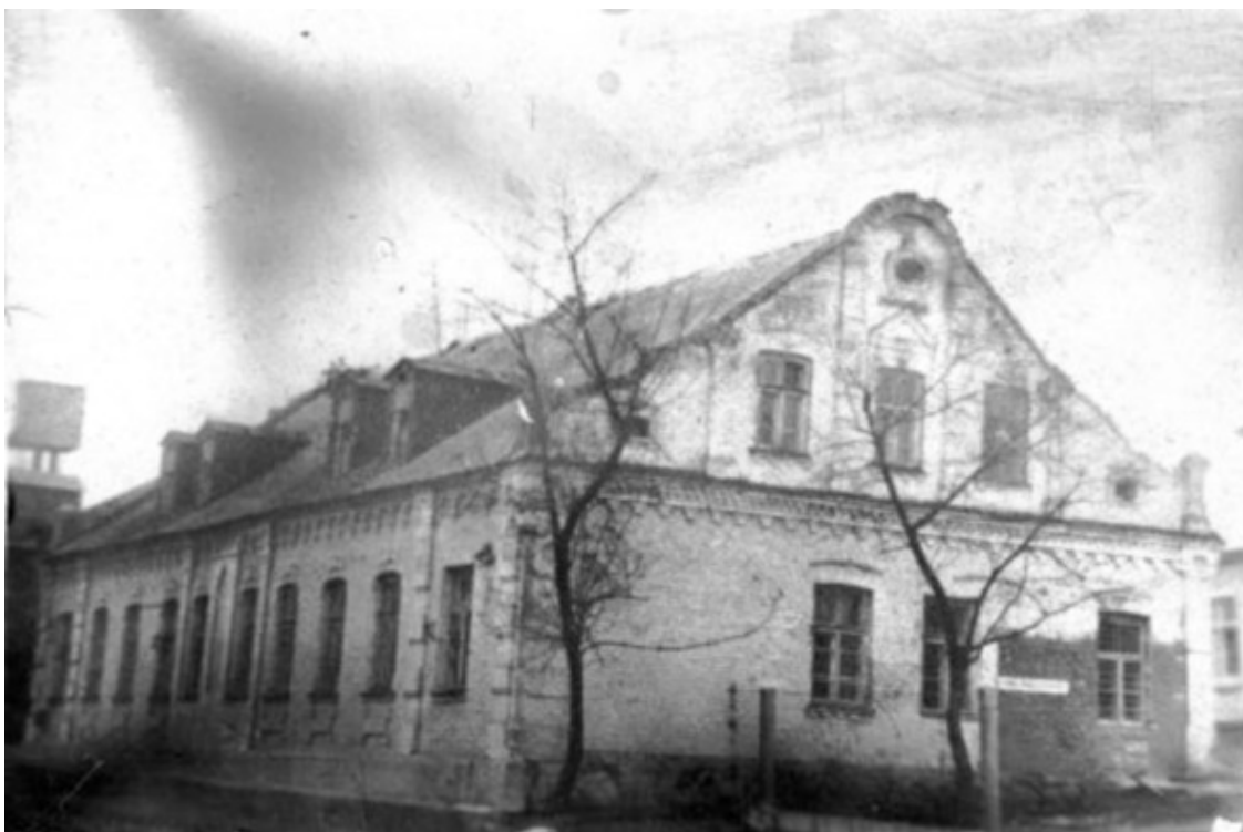
Здание пед. училища 1944 г. ул. Брестская.

В 2017 году в городе насчитывалось чуть больше 44 000 резидентов».