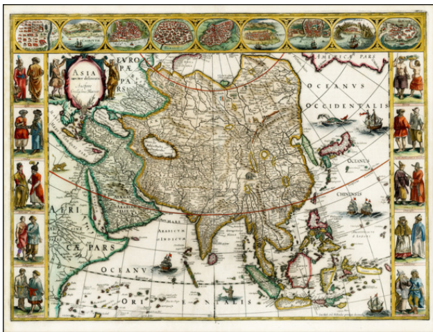
Тартария 1640 год