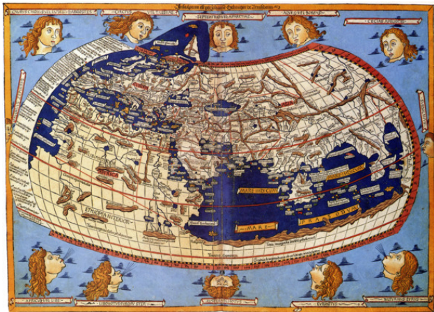
космография Николая Германуса 1482 год

При составлении этой новой карты мира mappa mundi , Мауро стремился показать то, что мореплаватели видели своими глазами, о чем рассказывали ему. Неизвестные территории он называл Terra Incognita , а для большей точности и достоверности использовал portolano Андреа Бьянко и более древние источники, датированные 1270 годом.