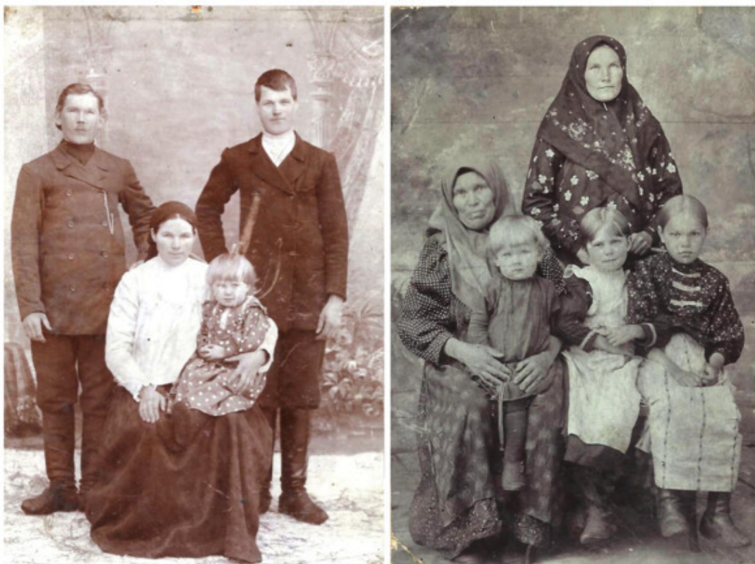
Старейшие жители Дикарей. Имена не известны. Начало XX века.

Главным занятием деревенских жителей было земледелие, а также рыболовство, пчеловодством, звериная и птичная охотой. Жило население за счёт своего хозяйства. Излишек продуктов сбывали на ярмарках, проходивших в крупных деревнях, где продавались мясо, хлеб, льняное семя, мануфактура, бакалейные товары, сани, сельхозинвентарь и прочее. Весной и осенью торговали лошадьми, а летом нанимали на полевые работы местных и пришлых из Казанской и Вятской Губерний и волостей Пермского уезда.