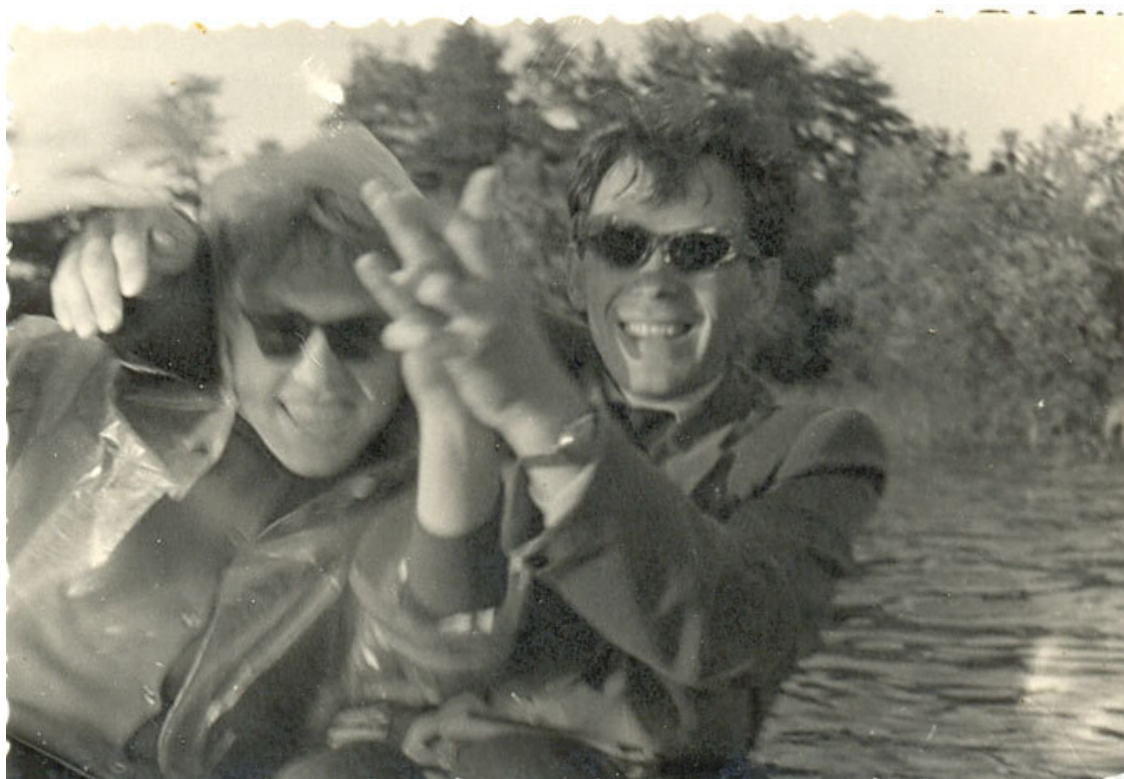
В командировке в Прибалтике