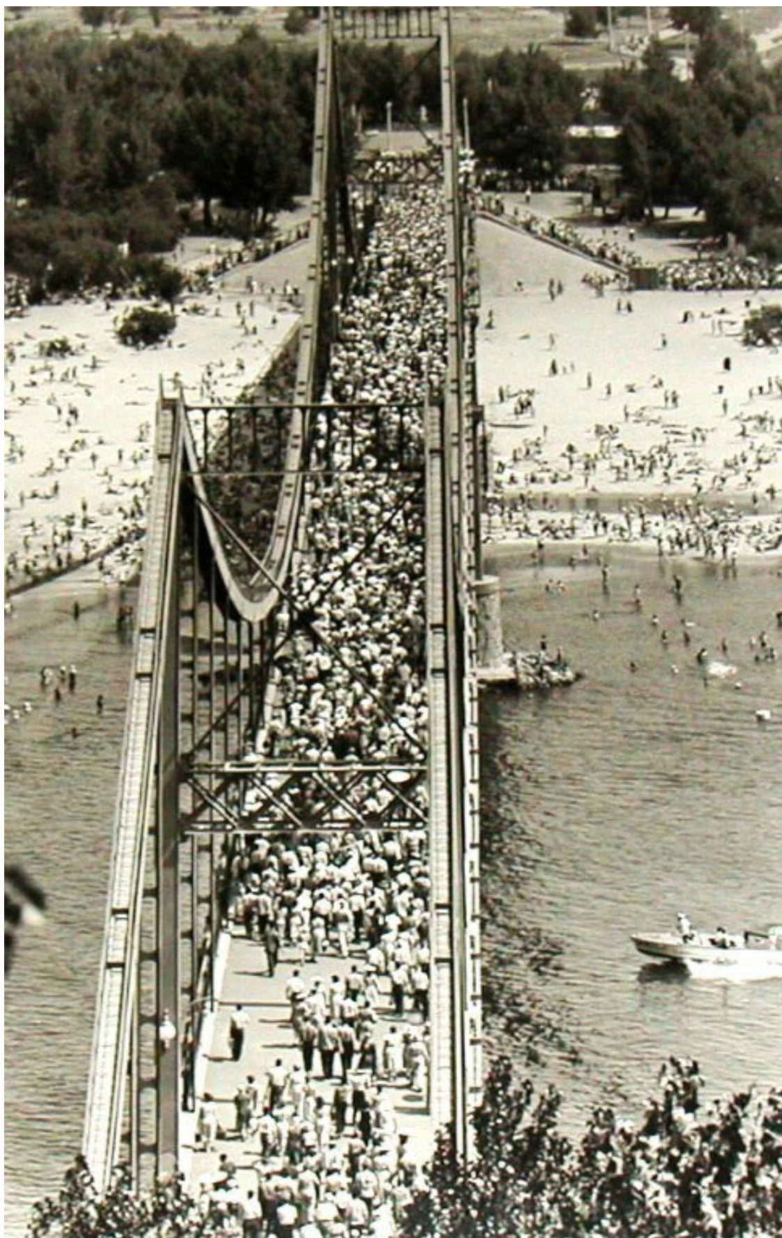
На фотографии – Старый Киев. Пешеходный мост. 1960 год.