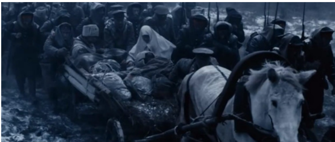
Ледяной поход белых. 1918 год.