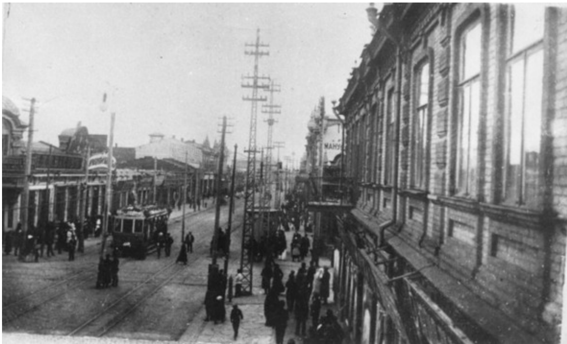
ул Красная, бывший меховой магазин Попсуйшапки с лева, 1919 год.

Бывший меховой магазин Попсуйшапки ул. Красная 92 в Краснодаре на перекрёстке Красной и Горького.