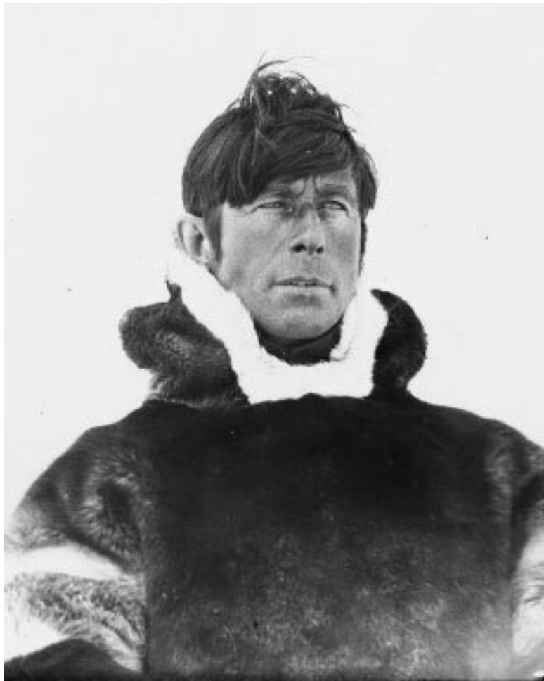
Кнуд Расмуссен во время длительной поездки на санях.