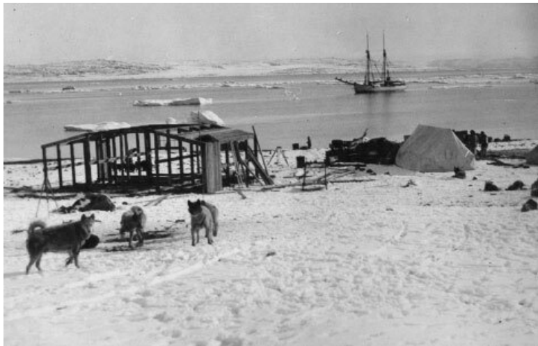
Строительство экспедиционной базы «Кузнечные мехи» на Датском острове.