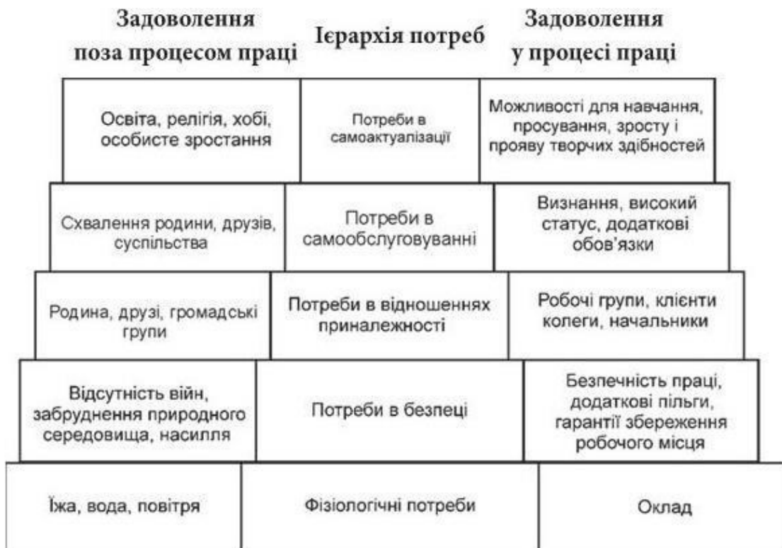
Рис. 5.2. Інтерпретація Р. Л. Дафтом ієрархії потреб людини за А. Маслоу і основних напрямів їх задоволення в процесі праці і поза нею

Потреби в самоповазі (повазі, визнанні, належності до якогось колективу, суспільства) у сфері праці відповідає прагнення до визнання, до підвищення свого статусу, до перебирання на себе додаткових зобов'язань, до отримання кредиту довіри; потреби в самоактуалізації (само-реалізації) в якості напрямів задоволення у сфері праці рекомендовано створення можливостей для навчання, прояву творчих здібностей, просування службовими сходами [11, с. 613].