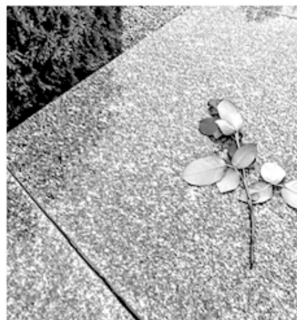
Прогулка после начала АТО