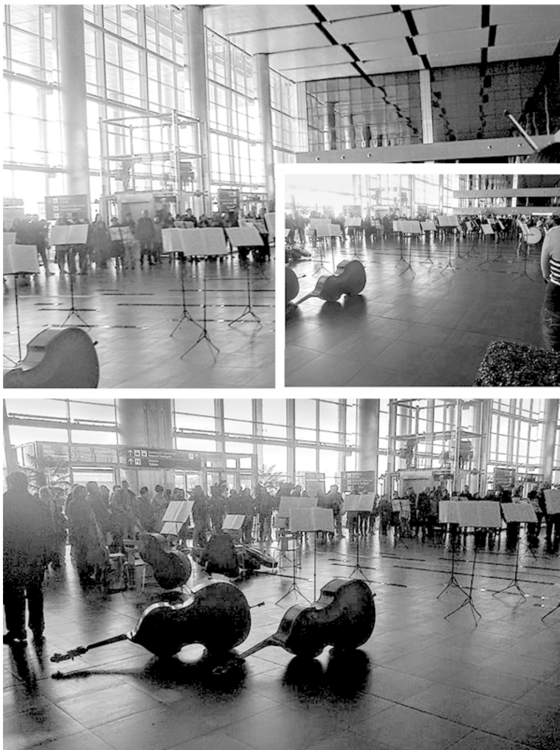
Флешмоб в Донецком аэропорту