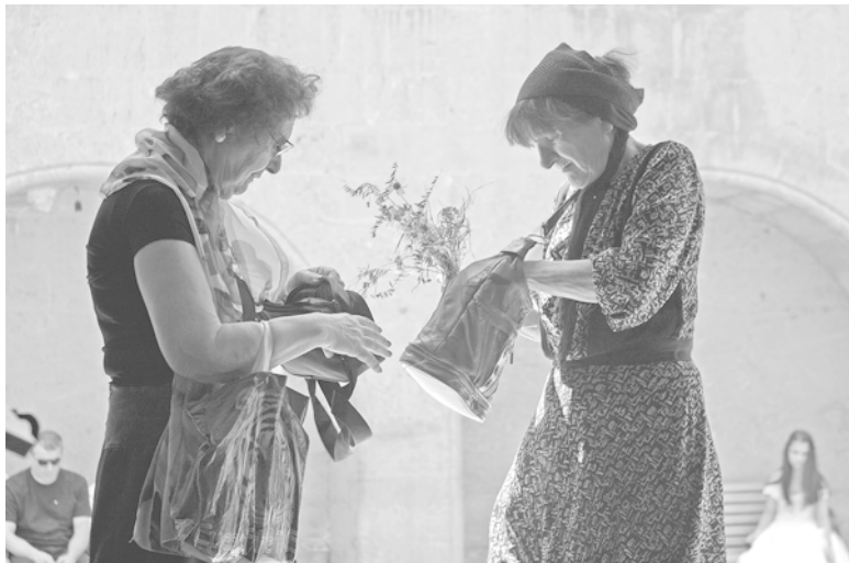
Прихожанки храма Сиони, центрального собора Тбилиси