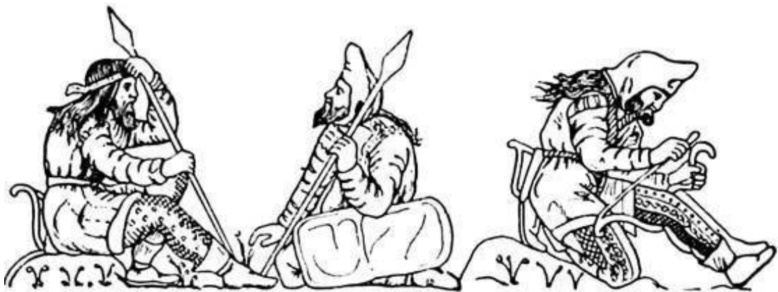
Скифские воины. Рельеф чаши из кургана Куль-Оба

Великое переселение народов – исторический процесс, который начался в конце II – середине III в. – вторжение готов на Волынь и Северное Причерноморье. Эти племена пришли из Южной Прибалтики и низовий Вислы, создав ряд политических объединений (самое известное – во главе с Германарихом в IV в.). Они воевали со славянами. Впоследствии большая часть готов под давлением гуннов переселилась на запад. Они появились в европейских степях в IV в. Гунны – это племена, пришедшие из монгольских степей, разгромившие аланов и готов. Во главе с вождем Атиллой гунны создали могучее объединение племен, в которое входили аланы, славяне, германские племена. После успешной борьбы с Римом это государство распалось, вскоре после 453 г., когда из-за интриг византийцев Атиллу коварно убили.