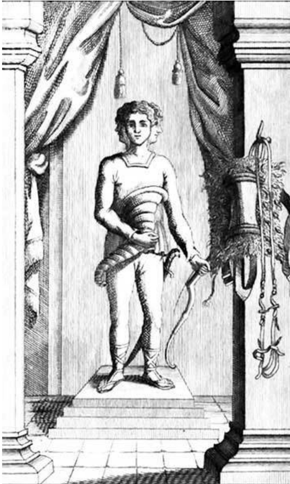
Изображение Световита (Световида, четырехликого бога). Гравюра XIX в.

Скульптурное изображение Святовита в 1848 г. выловили в р. Збруч, отправили в Краков, где он и по сей день находится в экспозиции Музея археологии. Уменьшенная копия идола стоит в Киеве на Владимирской улице! Позднее на главенствующее место выдвинулся военнo-дружинный культ Перуна – бога грома и молнии. Идолы (скульптуры) ставили в специальных местах – капищах (святилищах).