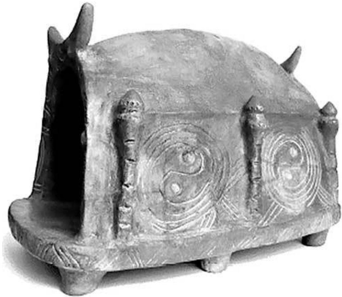
Ритуальная модель жилища. Трипольская культура