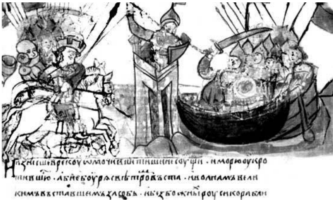
Взятие Константинополя Аскольдом и Диром. Миниатюра из Радзивилловской летописи, XIII в.

Консолидация восточнославянских племен закончилась при Владимире Святом, но предпосылки были на столетие раньше. Об этом сохранились лишь отрывочные сведения. Так под 6362 г. Новгородская первая летопись сообщает, что Аскольд и Дир «беста княжеша в Киеве, и владеюща Полями, и беша ратнии с Древлянами и с Улицю» . Этот же факт находим у В. Татищева, но с другой датировкой: «Оскольд же остался в граде том и, умножа варяги, наче владеть всею Польскою землею, имея войну с древлянами и со угличю» . Эта разница в датах в очередной раз подтверждает, что Татищев работал с некоторыми летописями, которые не дошли до XIX в., то есть до периода их серьезного изучения. Из текста следует, что Олегу, как узурпатору власти, принадлежавшей Аскольду, приходилось покорять племена, сосущее