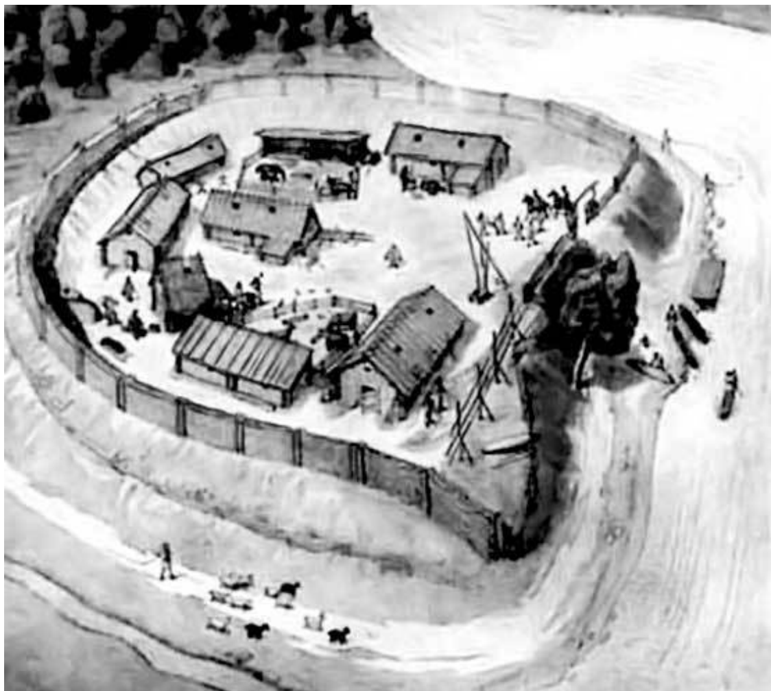
Типичное славянское городище на берегу реки (макет)

Трудно понять, какие именно давние поселения Приднепровья отразились в современных письменных источниках. Ряд исследователей пытались связать с Киевом один из приднепровских городов, названный в «Географии» Птолема – Метрополем. Уж очень похоже на «Мать городов». Но эта популярная гипотеза не имеет основания, потому что Птолемей имел в виду город возле Ольвии. Еще более безосновательной является отождествление с Данпарстадом, столицей готов, резиденцией короля Германариха. Этот город нужно искать где-то в районе современного Запорожья.