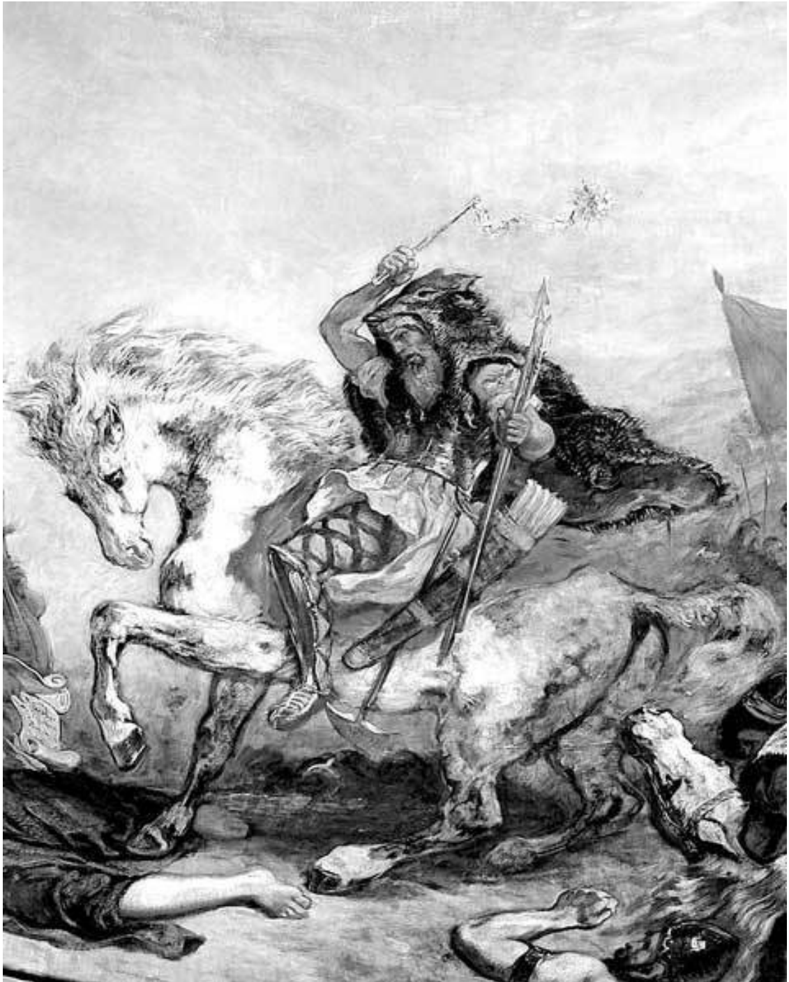
Атила. Худ. Э. Делакруа