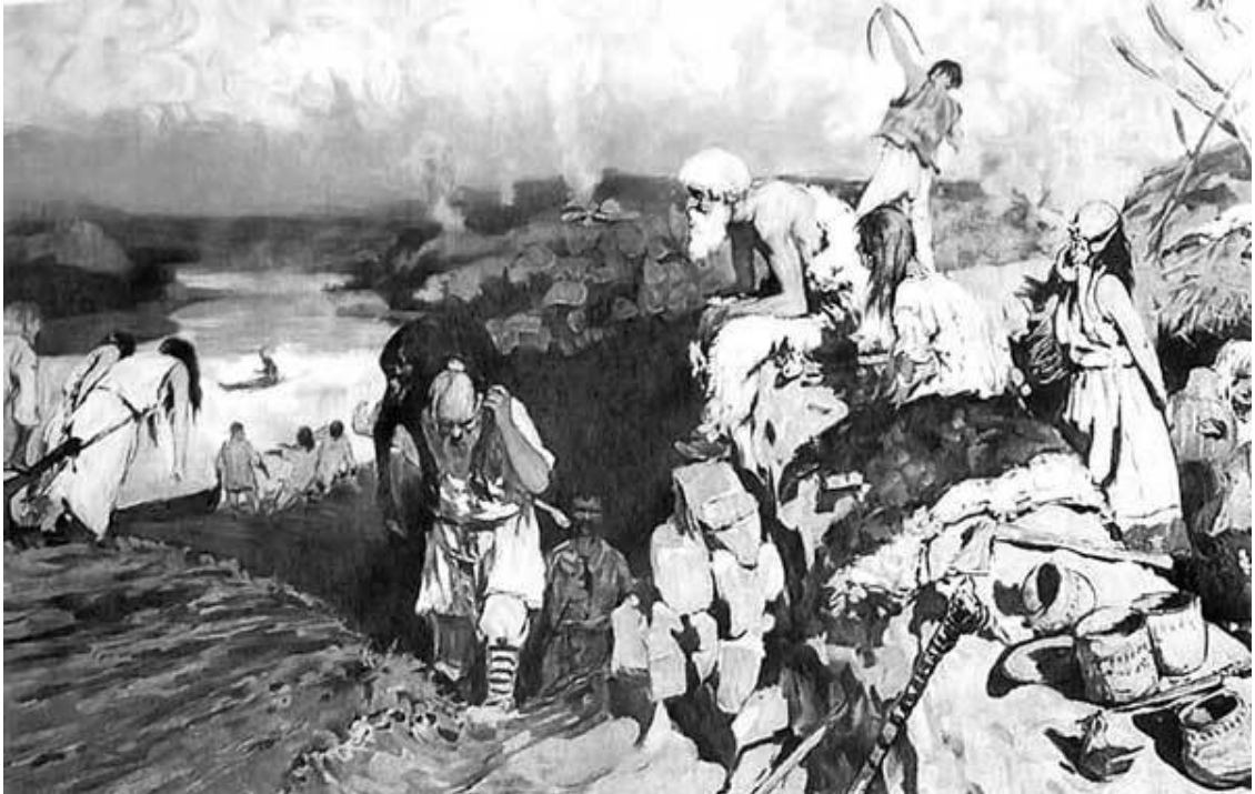
Сцена из жизни восточных славян. Худ. С. В. Иванов

Одинаково написанное слово и единство духовно-интеллектуальной традиции, конечно, рождали ощущение взаимного родства – но это только в тонком слое образованной элиты, ведь большинство ее было космополитично, принадлежало к различным культурам. Поэтому утверждать, что княжескую Русь заселяли люди, которые ощущали свою принадлежность к «единой древнерусской народности», – это то же самое, что на основе общего латиноязыкового школьничества утверждать существование «единой латинской народности» в пределах Западной Европы того времени. К сожалению, отсутствие письменных памятников языка до XI в., кроме сомнительной «Велесовой книги», свидетельств самосознания восточных славян до начала летописания, искаженное отражение этнического понимания в литературных памятниках XI—XIII вв., а также явная недостаточность письменных источников об этнических процессах в V–IX вв. не дают возможности однозначно ответить на ряд вопросов касательно этнических процессов в древнерусском обществе. Об этом мы имеем лишь отрывочные свидетельства соседей славян. Констатируем дискуссионность этой темы и наличие нескольких более-менее обоснованных концепций. Окончательно разобраться в поставленных проблемах помогут лишь будущие исследования. Как я люблю эту сентенцию: история повторяется, потому что не хватает историков с фантазией.