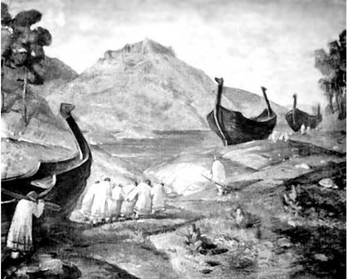
Волокут волоком (Из варяг в греки). Худ. Н. К. Рерих

Перейдем к изложению гипотезы Сергея Шелухина о кельтском происхождении Руси.