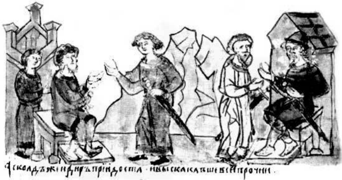
Князя Аскольд и Дир в Киеве. Миниатюра из Радзивилловской летописи, XIII в.