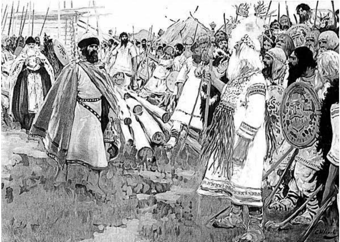
Русь языческая. Худ. С. В. Иванов

Немного остановимся на полюдье – главном источнике доходов киевских князей. На раннем этапе князьям самим приходилось собирать дань и получать разного рода подтверждения своей власти. Полюдье сопровождалось ритуальными действиями – торжественными клятвами в верности, пирами, охотой... Все происходило зимой, когда можно было объехать все селения по льду – дорог-то не было. Это важное действие было описано у Льва Диакона, так как на Балканский полуостров вывозили мед, воск, кожи, меха. Торговые функции выполняли дружинники, потому что в те беспокойные времена ватаги варягов могли напасть на менее защищенных, убить и ограбить их. Тип подобного воина-торговца сменился профессиональным «мирным купцом» – «торговым гостем» (когда правитель брал под защиту пути следования и торговцев). С древнерусским полюдьем связано одно занятное недоразумение. Константин Багрянородный сообщает о вывозе «мечей» из «скифских земель». Но широко известно, что их изготавливали во «франкских землях». Что такое дань мечами? Но тут неправильно поняли: слово, примененное императором, означает «прекрасный юноша». Стало быть, не торговля оружием, а рабами, взятыми на полюдье. Вот и получается, что «взять дань мечами» – набрать молодых людей на службу. «Меч» означает человека, могущего носить оружие. Первые «русы» принесли свое обозначение меча – «шверд», это слово означало табуированное, непристойное обозначение мужского полового органа.