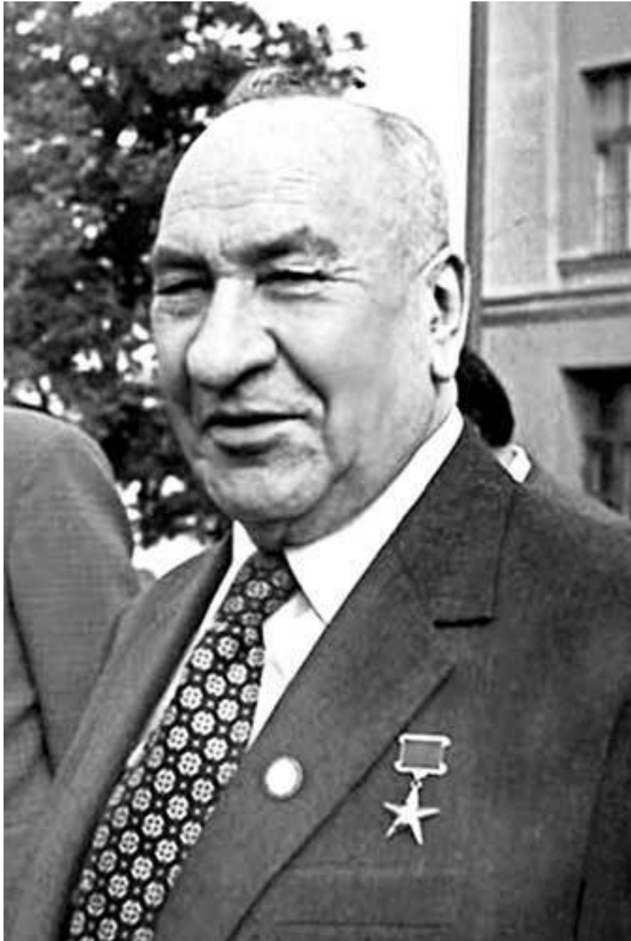
Академик Б. А. Рыбаков