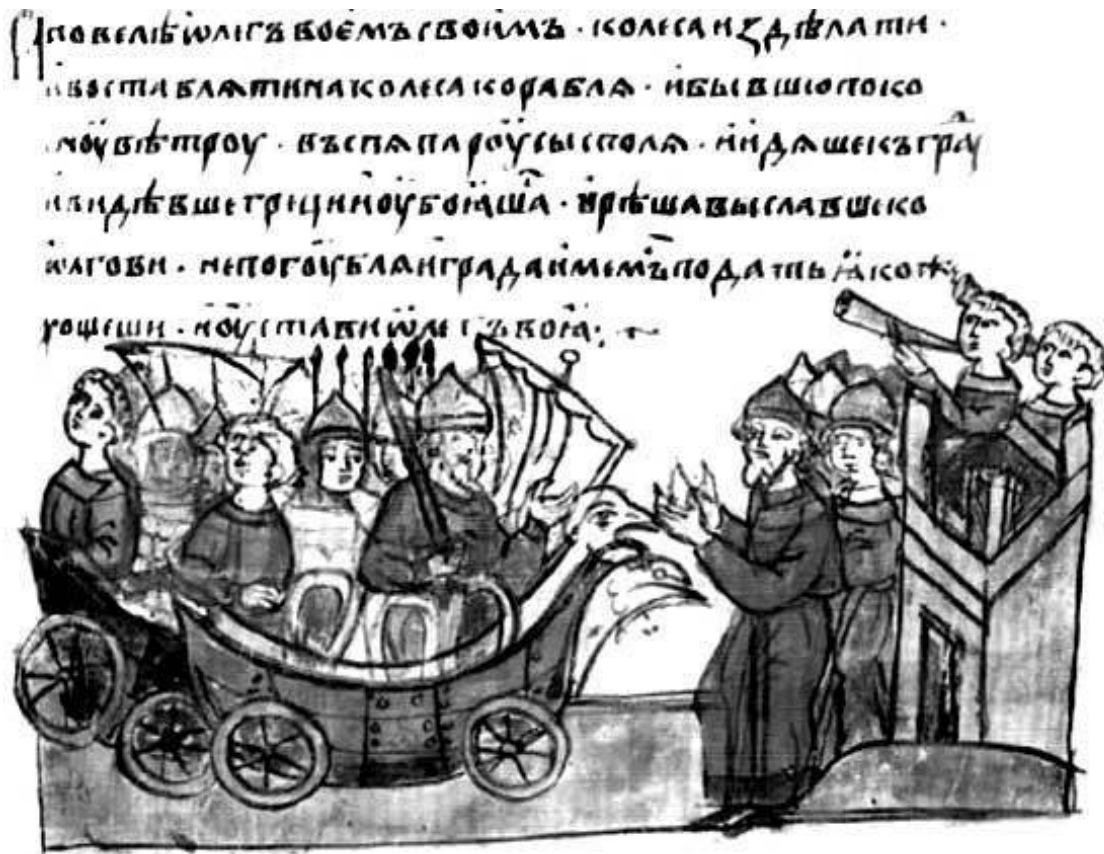
Взятие Олегом Вещим Константинополя Миниатюра из Радзивилловской летописи, XIII в.

Может статься, именно в той битве нашел свою смерть и князь Олег. Одна из летописных версий о его смерти гласит: умер Олег «за морем» (о возможных причинах возникновения нескольких версий смерти этого государственного деятеля мы поговорим ниже). Долгое время этот эпизод был единственным, омрачавшим отношения Хазарии и Киевской Руси во главе с династией Рюриковичей. Но в конце концов гром грянул, и инициаторами его оказались византийцы, видимо, намеревавшиеся передать звание своего главного союзника в регионе кому-то другому. Император Роман Лакапин, узурпировавший престол, решил поднять свою популярность посредством гонений на евреев, которых он распорядился силой принуждать креститься. Со своей стороны, хазарский царь Иосиф, похоже, тоже провел акцию в отношении нелояльных, по его мнению, подданных. Тогда Роман уговорил некоего «царя Русов» Х-л-гу напасть на хазарский город Самкерц, более известный как Тмутаракань. (Это – к вопросу о походе на хазар вешего Олега.) Месть хазар была воистину страшной. Хазарский полководец Песах, носивший титул, который разные исследователи читают, как Булщи или «баликчи», во главе большой армии сначала разорил византийские владения в Крыму, дойдя до Херсона, а затем направился против Х-л-гу. Он принудил последнего не только выдать награбленное, но и отправиться походом на... Романа Лакапина.