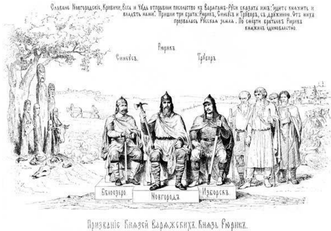
Рюрик, Трувор и Синеус. Гравюра 1884 г.