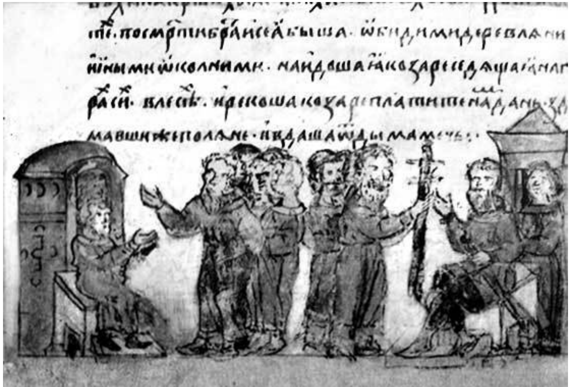
Дань хазарам. Миниатюра из Радзивилловской летописи, XIII в.