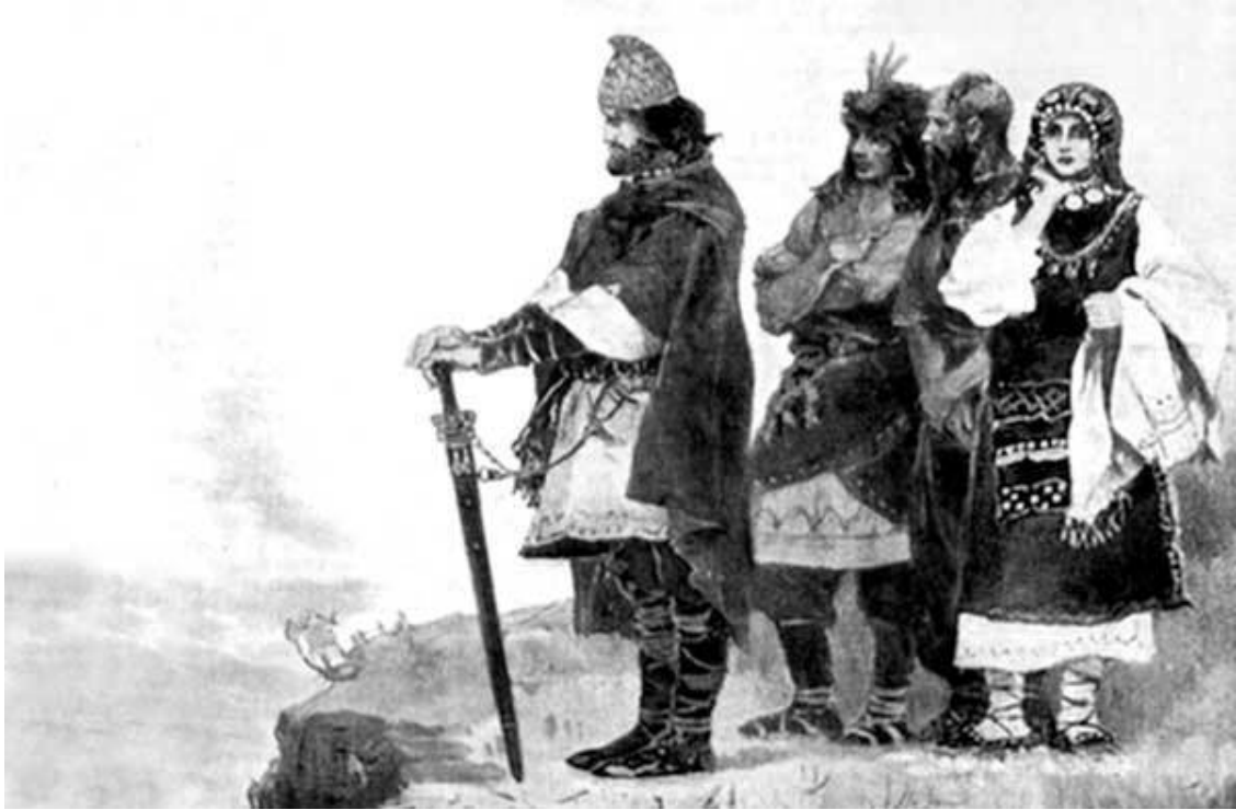
Кий, Щек, Хорив и сестра их Лыбедь. Худ. И. С. Ижакевич

Седяше Кий на горе, где же ныне узвоз Боричев, а Щек седяше на горе, где ныне зовется Щекавица, а Хорив на третьей горе, от него же прозвалась Хоревица. И сотвориша град во имя брата их старейшего, и нарекоша имя ему Киевъ. Бяше около града лес и бор велик, и бяху ловяща зверь, бяху мужи мудри и смыслени, нарицахуся поляне, от них же есть поляне в Киеве и до сего дне».