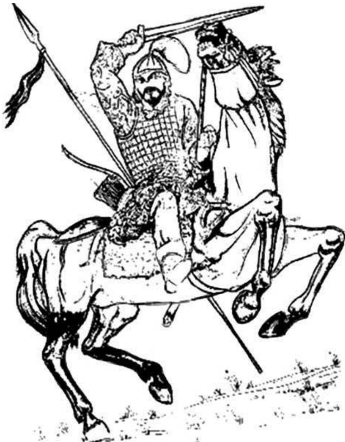
Хазарский воин. Гравюра XIX в.

«Как ныне собирается вещей Олег отмстить неразумным хазарам...» Обычно именно этими пушкинскими строками ограничивается все знакомство современников с Хазарией. Хазары – самый интригующий и загадочный народ в истории не только Восточной Европы, но, возможно, и всей ойкумены (так в Древнем мире называли территорию, заселенную цивилизованными народами). С одной стороны, это влиятельнейшая историческая сила в I тыс., создавшая большую и могущественную державу – достойного соперника Византийской империи, Арабского халифата, Киевской Руси. С другой стороны, эта этническая группа, по сути, не имеет собственной истории, являясь какой-то бесплотной историографической фикцией, которая вызывает определенный скепсис.