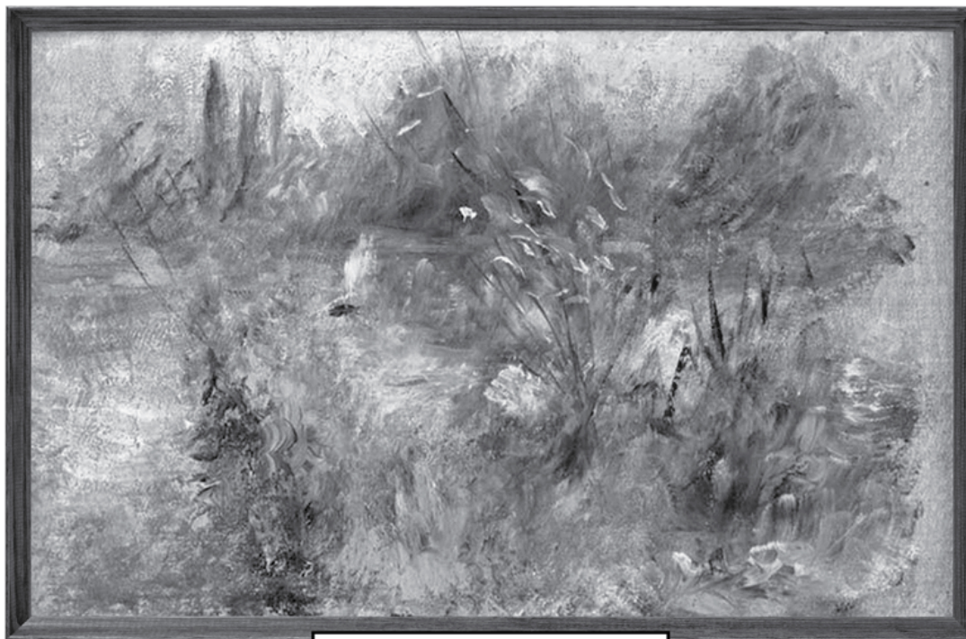
Пьер Огюст Ренуар «Пейзаж на берегу Сены» Дата создания: 1879 г.

Украдена из Балтиморского музея искусства в 1951 году.