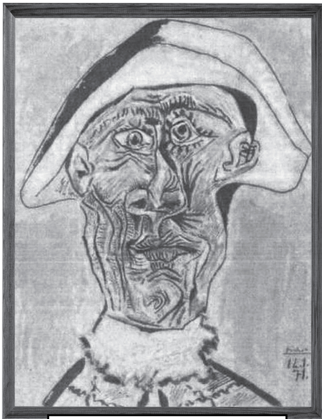
Пабло Пикассо «Голова арлекина», 1971 г.

Похищена из музея «Кунстхал» в Роттердаме 16 октября 2012 года. Текущий статус: картина уничтожена.