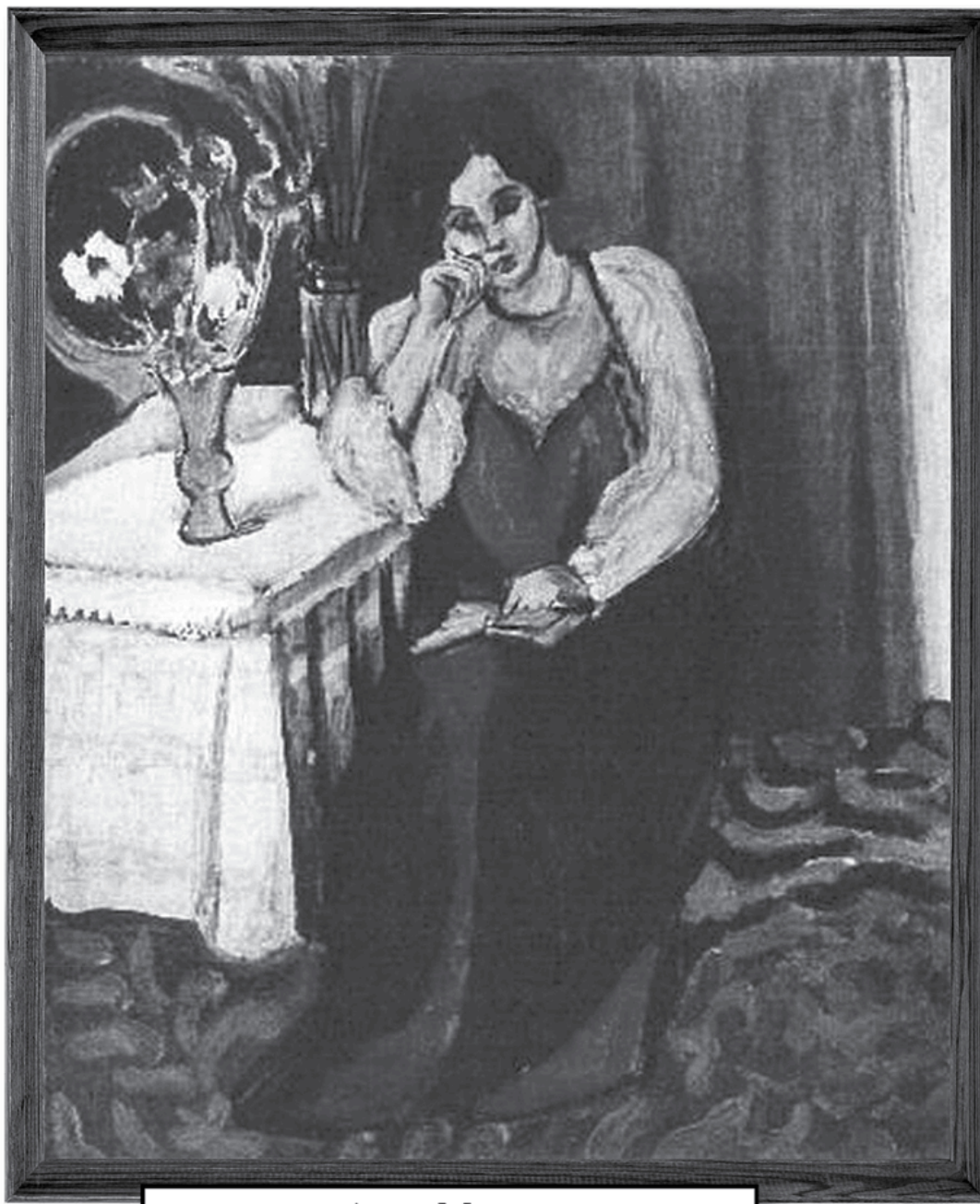
Анри Матисс «Читающая девушка в белом и жёлтом» Дата создания: 1919 г.

Украдена из музея «Кунстхал» в Роттердаме 16 октября 2012 году. Текущий статус: картина уничтожена.