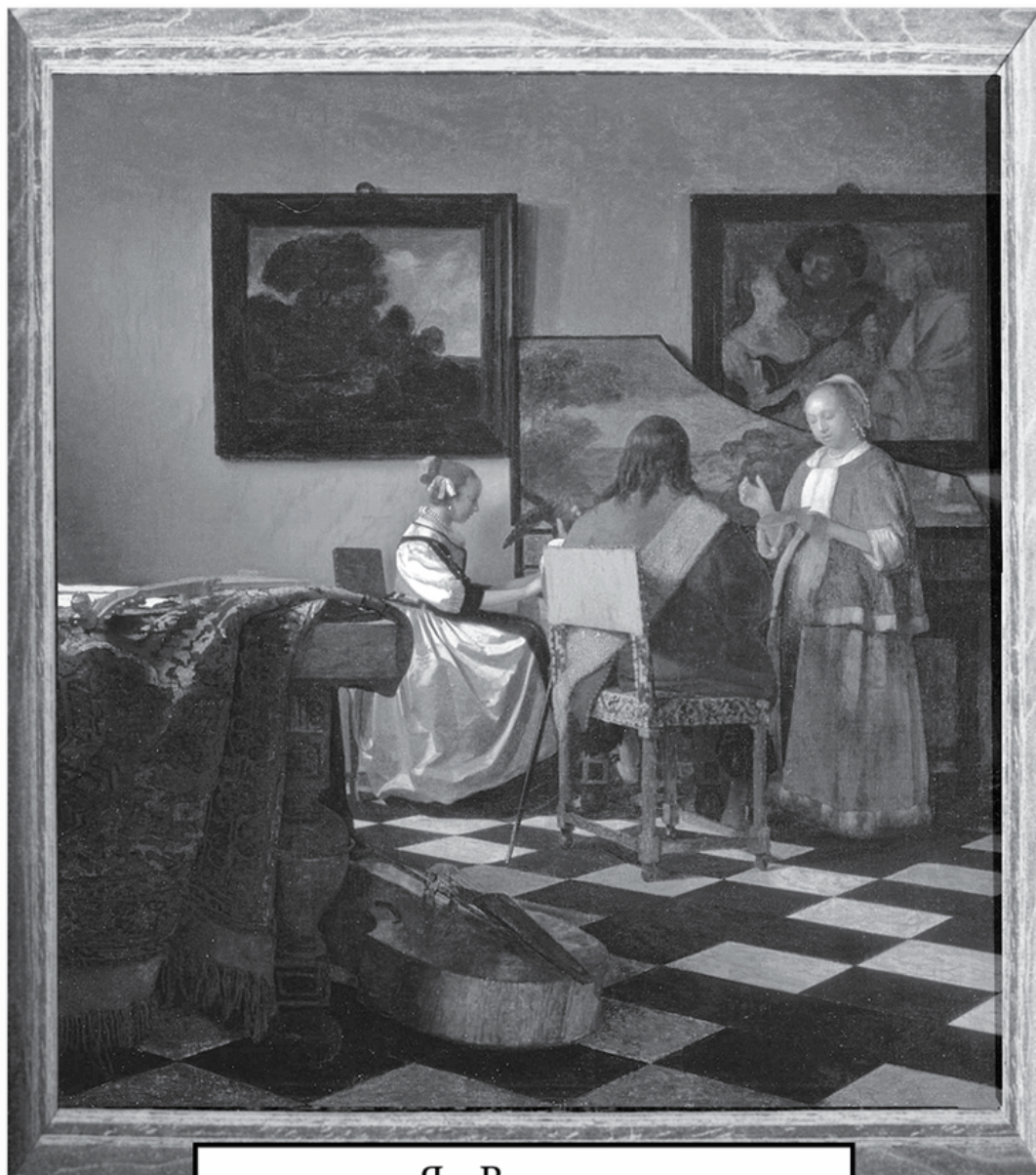
Ян Вермеер «Концерт» Дата создания: 1658—1660 гг.

Украдена в Бостоне из личного музея Изабеллы Гарднер в 1990 г. Грабители выдавали себя за полицейских.