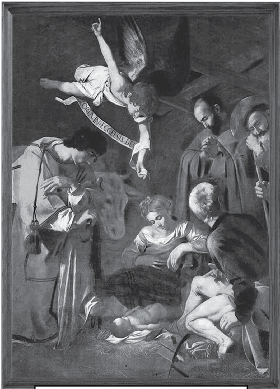
Микеланджело Меризи да Караваджо «Рождество со святым Франциском и святым Лаврентием» Дата создания: 1609 г.