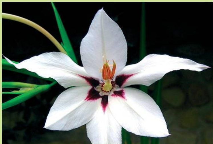
У ацидантеры — колосовидное соцветие

Детки. Это вегетативная форма размножения. Детки могут образовываться либо из пазушных почек между чешуями и донцем (а из центральной развивается цветонос), либо из верхушечной почки (а цветонос – из пазушной). При этом дочерние луковицы находятся внутри материнской и постепенно перемещаются к периферии, поэтому взрослая луковица бывает многовершинной.