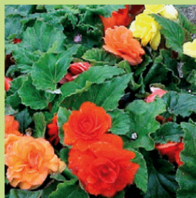
Соцветие у бегонии — сложная метелка

Корни. В зависимости от продолжительности существования, корни луковичных растений бывают однолетние и многолетние. Первые отмирают вместе с вегетирующей частью, вторые существуют несколько лет и с течением времени заменяются новыми корнями. Если растение находится в благоприятных условиях (умеренная температура, наличие влаги), то из основания донца могут появиться многочисленные придаточные корни.