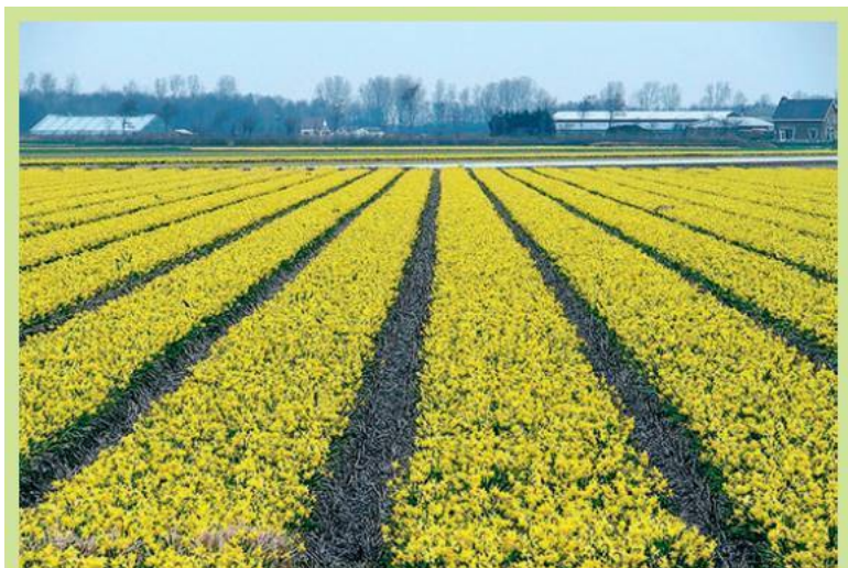
Так выращивают нарциссы

точные запасы питательных веществ, необходимых для развития растения. Она подобна спящей красавице, разбудить ее может лишь стечение благоприятных обстоятельств. Но если она проснулась – целые страны падали к ее ногам.