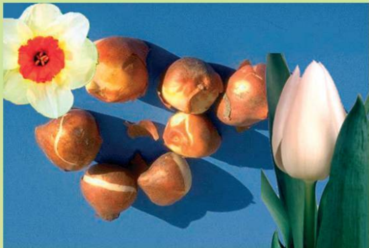
Луковицы различных растений

Отдыхающие луковицы, в зависимости от формы и размеров чешуек, делятся на: