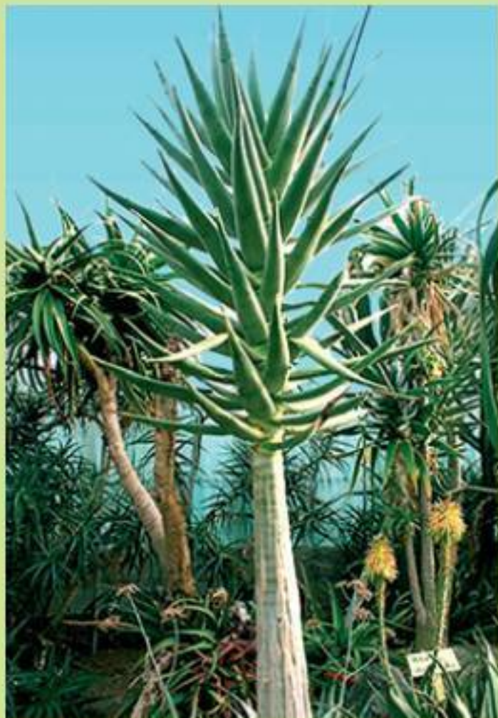
Алоэ похоже на небольшое