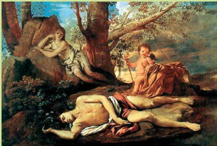
Никола Пуссен. Нарцисс и Эхо

В жаркий полдень молодой Нарцисс наклонился попить из ручья и в его светлых струях увидел свое отражение. Молодой человек никогда раньше не встречал подобной красоты и потому потерял покой. Каждый день приходил он к ручью, погружал свои руки в воду, стараясь обнять того, кого видел, но тщетно – проклятье нимфы сбылось. Нарцисс полюбил того, кто не мог ответить ему взаимностью, – самого себя.