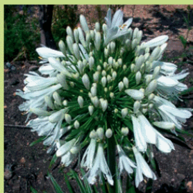
У аганпантуса — зонтиковидное соцветие