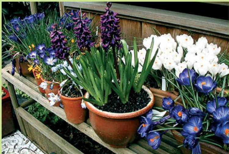
Луковичные растения используют как комнатные растения

В Украине произрастают лилии, тюльпаны, луки, подснежники, белоцветники, пролески, рябчики и другие. Многие из луковичных растений используют как декоративные, овощные (многие виды лука), лекарственные (морской лук, черемша, подснежники и другие). Декоративные луковичные растения выращиваются и как комнатные растения (амариллис, кринум и другие) и как клумбовые (тюльпаны, нарциссы, гиацинты).