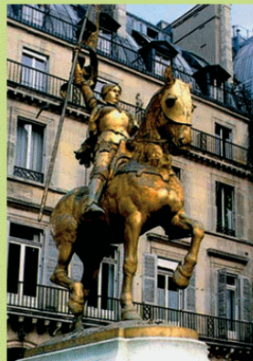
Конная статуя Жанны д'Арк на площади Пирамид в Париже