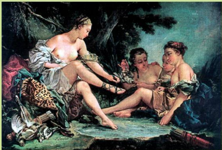
Ф. Буше. Диана возвращается с охоты

Одна из легенд говорит, что ландыши – это нежный счастливый смех Мавки, жемчужинами раскатившийся по лесу, когда она впервые почувствовала радость любви.