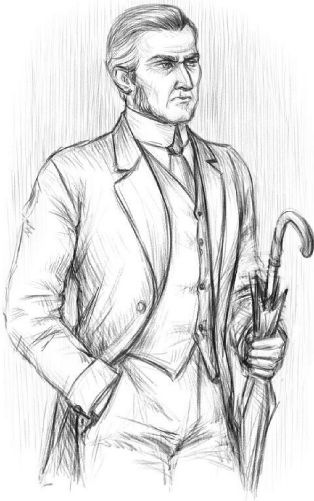
Джон Уильям Кембрич