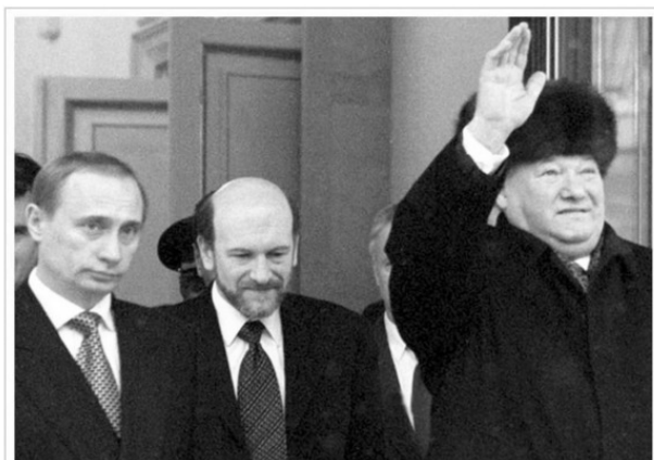
Б.Ельцин покидает Кремль, 31 декабря 1999 год.

Создано в интеллектуальной издательской системе Ridero