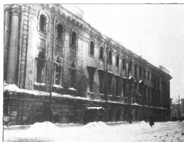
Сгоревшее здание окружного суда

лидер меньшевистской фракции Государственной думы Н. С. Чхеидзе. Меншевикам и эсерам удалось завладеть их доверием. Несмотря на преобладание в Совете эсеров и меньшевиков, петроградские большевики в этот начальный период при поддержке масс добились принятия ряда революционных решений; была создана рабочая милиция для охраны революционного порядка в городе и подавления антинародных действий reactionеров, произведены выборы депутатов в Совет от солдат.