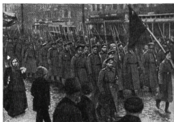
Войска переходят на сторону восставших