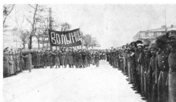
Одним из первых полков, перешедших на сторону революции, стал Вольнский полк

26 февраля (воскресенье) политическая стачка и демонстрации перерастают в восстание. Полиция и офицеры из пулемётов расстреливают рабочую демонстрацию на Невском проспекте, десятки рабочих убиты и ранены. Так началось второе Кровавое воскресенье. В разных концах Невского и на Знаменской площади было убито около двухсот человек, многие сотни были ранены или получили увечья, спасаясь от выстрелов. К 4 часам дня Невский был «очищен» от демонстрантов, о чем министры победно донесли царю. Однако уже в этот день одна из рот запасного батальона Павловского полка, размещавшаяся в здании Конюшенного ведомства на Конюшенной площади, отказалась стрелять в народ, а вместо этого обстреляла на Екатерининском канале взвод конно-полицейской стражи. Солдат окружили и загнали обратно в казармы. Они выдали 19 «зачинщиков», которых тут же отправили под арест в Петропавловскую крепость.