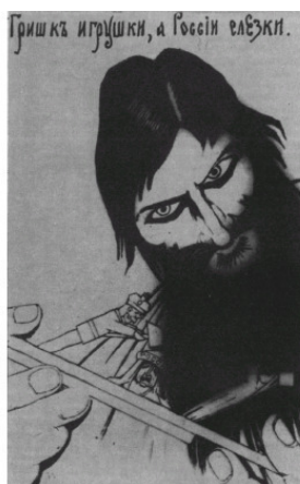
«Гришке игрушки, а России слёзки» (дореволюционная карикатура)

27 декабря А. Ф. Трепов смещён, Совет министров возглавил князь Н. Д. Голицын.