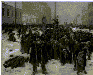
«9-е января 1905». Картина художника В. Е. Маковского

сториками сведения, что якобы Николай II не знал, кто именно отдал приказ о расстреле мирной демонстрации. Всё он прекрасно знал, так как сам был соучастником кровавой бойни!