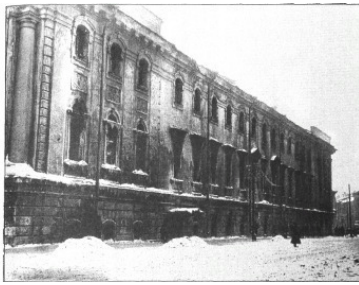
Сгоревшее здание окружного суда