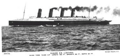
OSWALD B.S. LUSITANIA 35000 TONS 76000 HP LENGTH 280 FT BREADTH 88 FT DEPTH 60 FT HOBART PHOTO 2-1