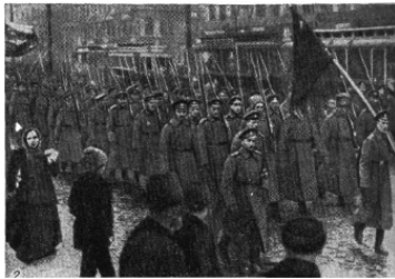
Войска переходят на сторону восставших