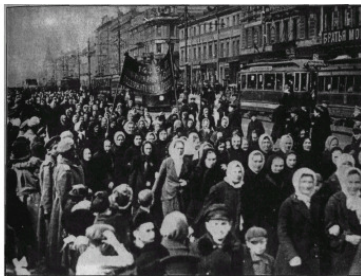
Демонстрация солдаток. Март 1917 года

5 марта возобновлён выпуск большевистской газеты «Правда». Образован Московский Совет рабочих и солдатских депутатов. Повсеместно создаются Советы рабочих и солдатских депутатов, большинство в которых первоначально захватили меньшевики и эсеры.