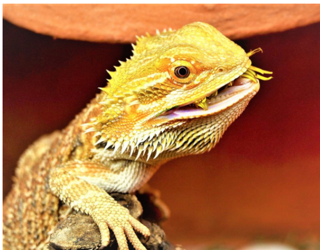
Бородатая Агама (Bearded agama)

Влечение Синезыкого, как и у людей, быстро закончилось. А Тиликва поняла, что она полюбила вовсе не язык, а бессмертную душу Синезыкого. После того, как тот не пришёл на седьмую ночь, Тиликва пришла в отчаяние. Потому что было ясно: это – конец. Затем её предположение подтвердили и подруги: «Твой теперь встречается с Бородатой Агамой».