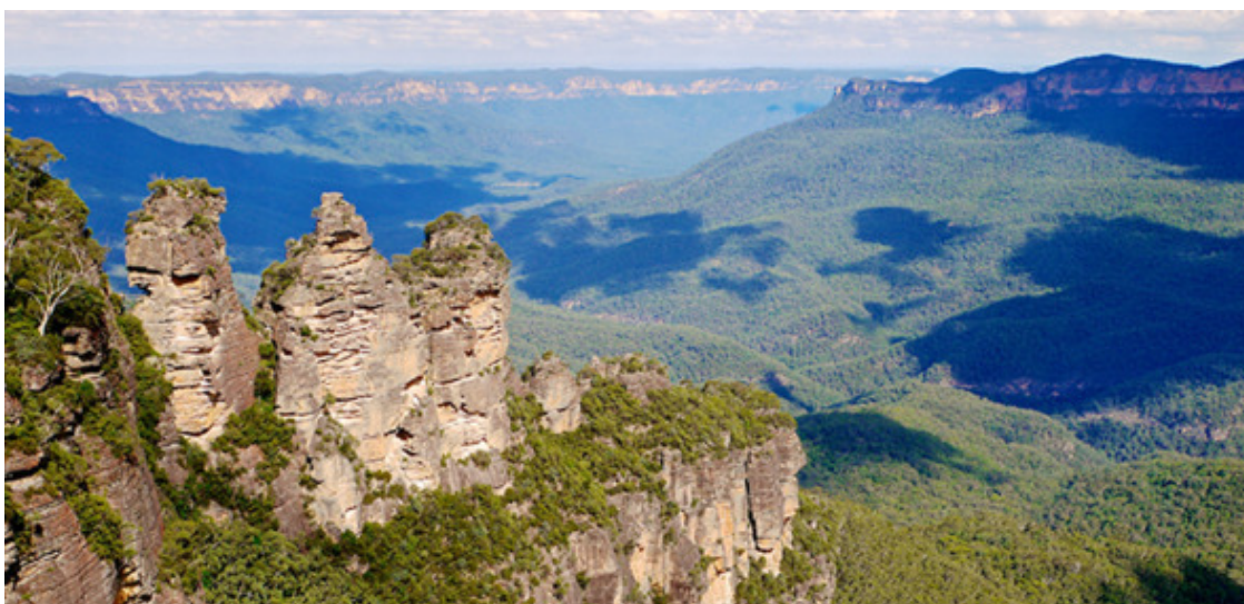
Голубые горы. Скалы Три сестры

От Сиднея – около ста километров в глубь континента. Прямо в порту я брал такси, это не дорого. А так транспорт там в основном до Катумбы (Katoomba). Катумба – туристское место, столпотворение, непереносимое для стремящего к уединению. Это про меня: я не переносу.