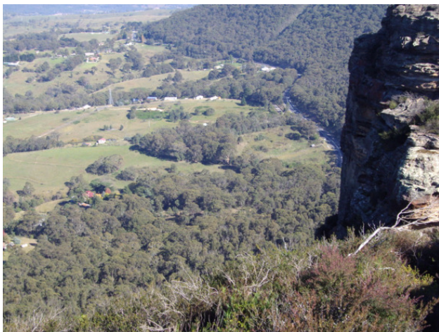
Вид на окраину Литгоу со стен Хассанс (Hassans Wals).