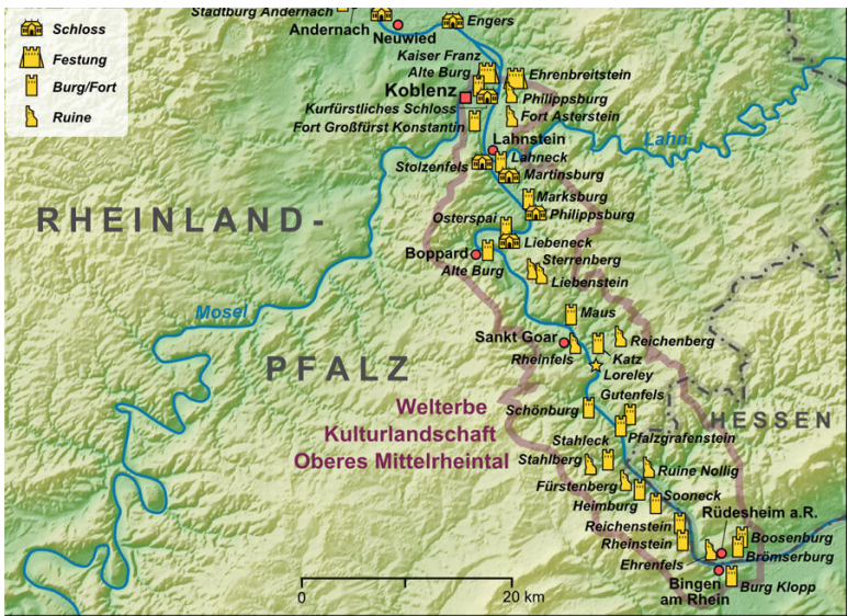
Карта замков Среднего Рейна (из Википедии).