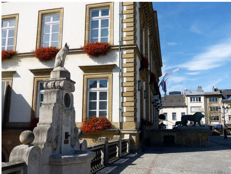
Place Guillaume II, памятник Мишелю Роданжу и ратуша Люксембурга.

ном. Лис обводит вокруг пальца Льва Нобля (короля), постоянно насмехается над глупостью Осла Бодуэна (священника). В 1872 году вышла книга «Ренар или Лис в человеческом облиии», написанная Мишелем Роданжем на люксембургском языке. Ныне считается, что это высшее достижение местной литературы в XIX веке. В 1932 году Мишелю Роданжу поставили памятник возле ратуши Люксембурга.