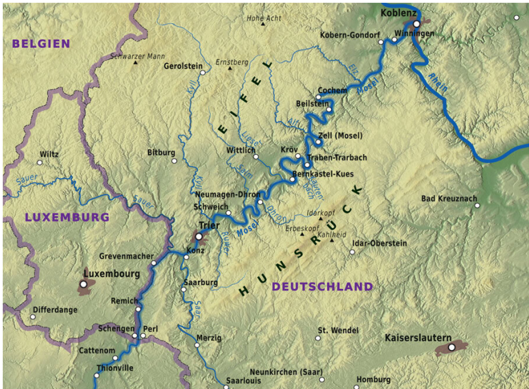
Карта нижнего течения Мозеля.