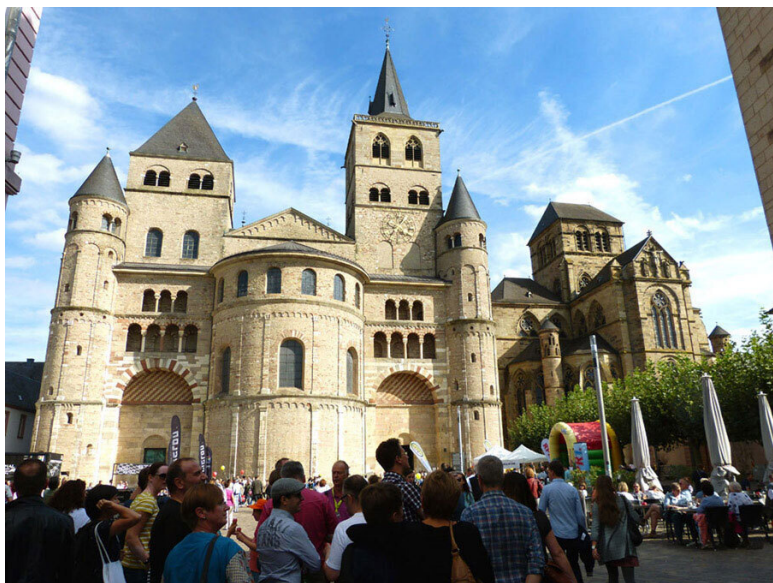
Трирский собор и Liebfrauenkirche.

ный алтарь, а потом обнаружили, что на алтарь можно подняться. Оказалось, что туда проходят через бывшую сокровищницу, ныне являющуюся музеем. Поднялись по лестнице, купили билеты и вышли на площадку главного алтаря. Между двумя мраморными фигурами апостолов Петра и Иоанна там существует отверстие, через которое видна Heiltumskapelle, часовня, построенная в начале XVIII века. Именно в ней хранится главная реликвия собора, Риза Господня. Публике её показывают очень редко.