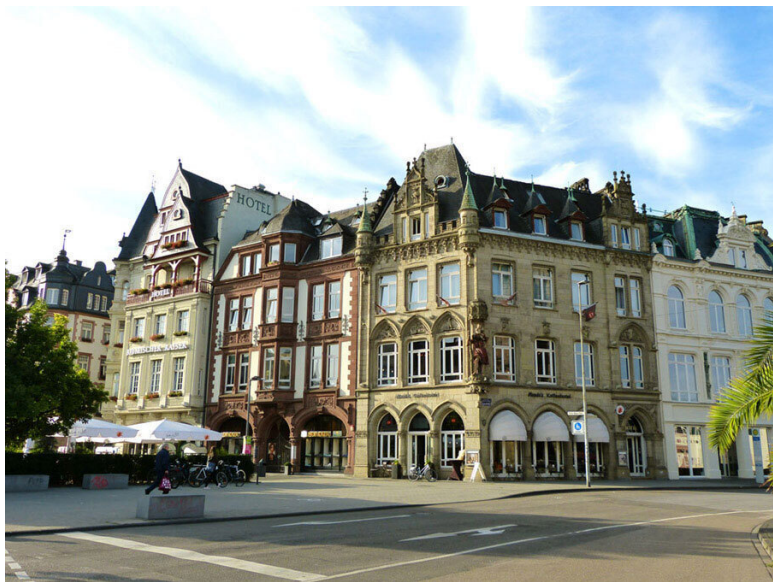
Здания возле Porta Nigra.

построенный в 1895–1897 годах. Его угол на втором этаже украшает изваяние святого Христофора с младенцем Иисусом на спине.