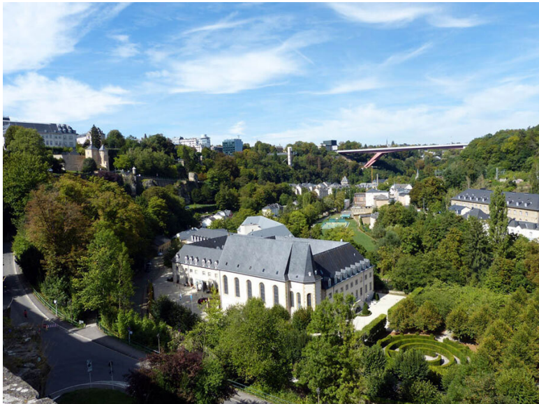
Вид со скалы Бок на Pfaffenthal.