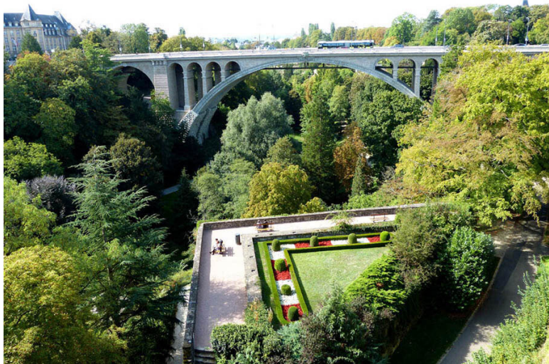
Вид на долину Петруса и на мост Adolphe-Bréck.

С площадки перед Золотой Дамой открывается прекрасный вид на долину Петруса и противоположный берег реки. Полюбовавшись ими, мы направились в собор.