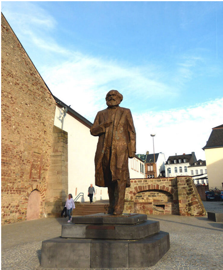
Памятник Карлу Марксу в Трире, подаренный властями КНР.