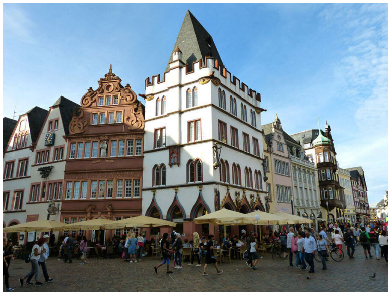
Rotes Haus u Steipe.

К Steipe примыкает барочный Rotes Haus. Этот дом с фасадом из красного песчаника и статуей Антоний Падуанского на фасаде появился в 1684 году. Его выстроили для секретаря Трирского собора Иоганна Вильгельма Полча. А ещё на фронтоне этого здания выбито изречение легендарного основателя Трира Нинуса Требеты.