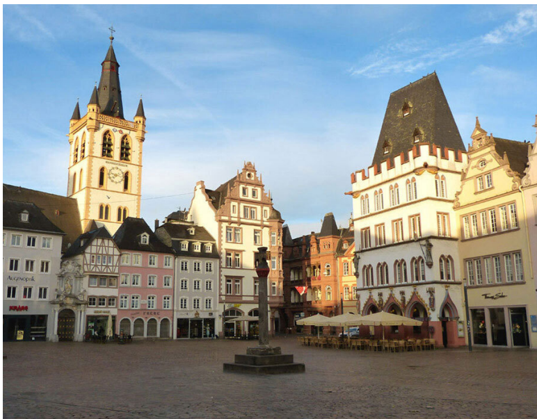
Трир, главная площадь, Hauptmarkt.

Все дома площади, уничтоженные в 1944 году при обстрелах и бомбёжках, были воссозданы в соответствии с довоенными фотографиями. Самым старым является готическое здание Steipe с чёрной шатровой крышей и зубчиками на фасаде чуть ниже неё. Его возвели в 1430 году как дом собраний и приёмов. Затем в 1481–1483 годах Steipe расширили и перестроили, после чего до XVIII века оно являлось ратушей. Во время Второй мировой здание было полностью разрушено, но в 1968–1970 годах его восстановили.