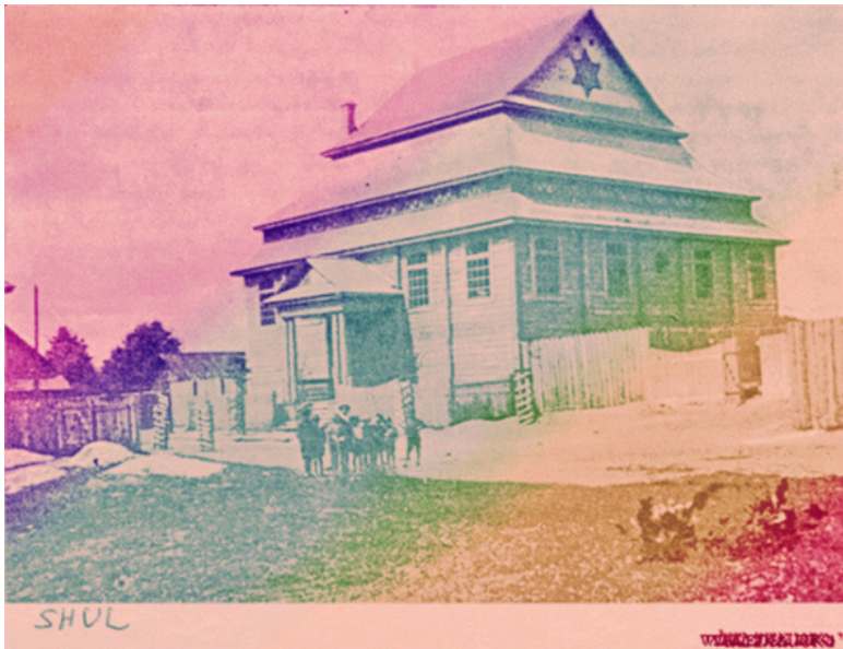
Синагога в Вилейке.