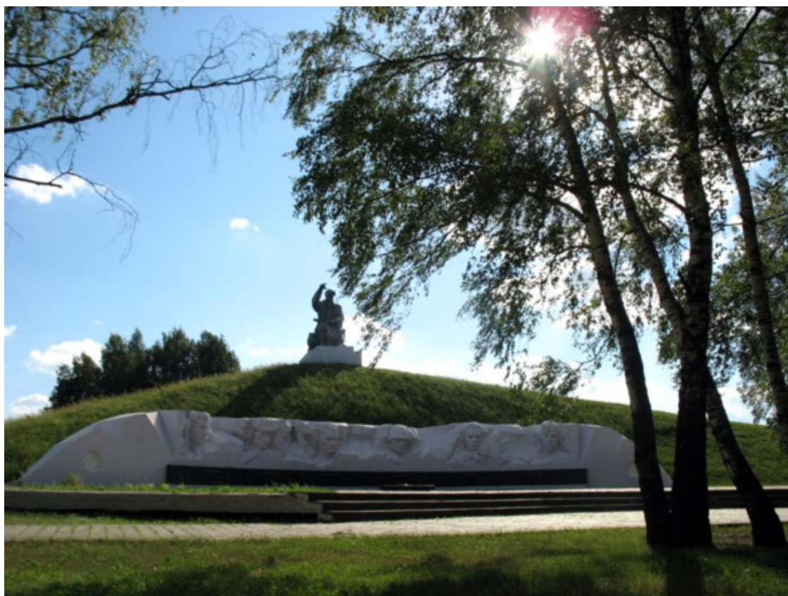
Мемориал воинской славы в около деревни Лудчицы.