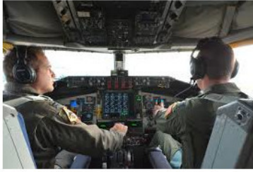
Рисунок 18. Пока самолетом управляет автопилот, пилоты могут поговорить или перекусить