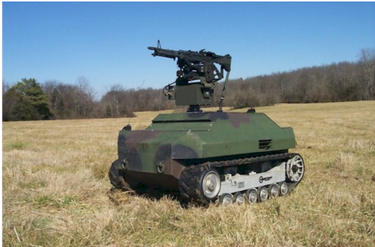
Рисунок 15. Боевые роботы

– автоматизированные системы ПВО , защищающие войска уже не только от самолетов и ракет, но и от мин и снарядов.