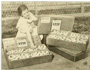
Рис.5. Промышленный инкубатор 1919 год

Отметим, что аналогичны результаты строительства птицефабрик в СССР в 1970-1990-х годах. Потребность в яйцах и мясе птицы была настолько велика, что все освобожденные на птичьих фермах в сельском хозяйстве рабочие получили, после переподготовки, рабочие места на птицефабриках.