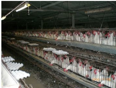
Рисунок 6. Птицефабрика