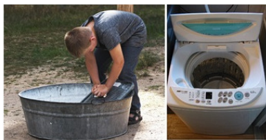
Рисунок 11. Ручная и машинная стирка

Современные машины не только стирают белье по заданной программе, но и сушат его.