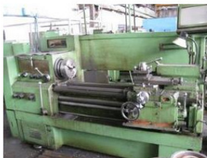
Рисунок 3.Токарный станок

И, наконец, из системы анализа и принятия решений.