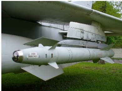
Рисунок 13. Новое оружие. Ракеты воздух-земля системой наведения