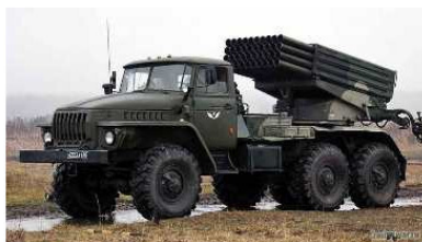
Рисунок 12. Система залпового огня БМ-21 (40 снарядов калибра 122 мм, площадь поражения – 14,5 гектар, боевой расчет – 3 человека)

Одна современная система залпового огня может заменить несколько десятков батарей пушек со снарядами.