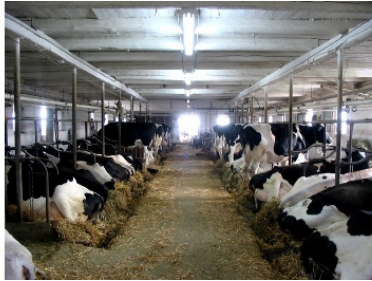
Рисунок 7. Коровник

сы многократно повысили производительность труда доярок. Фактически это промышленные предприятия, где коровы рассматриваются как биологический механизм.