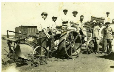
Рисунок 9. Первые трактора