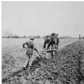
Рисунок 8. До появления тракторов пахали на лошадях