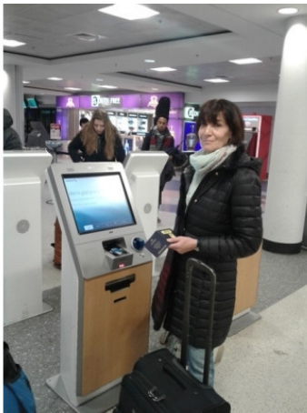
Рисунок 19. Паспортный контроль в аэропортах США