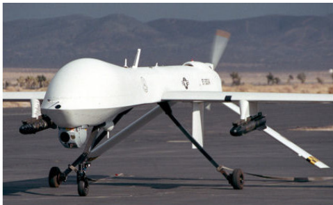
Рисунок 14. Современные дроны с самонаводящимися ракетами

ют системы залпового огня. Но вместо снарядов на них установлены беспилотные аппараты. Так небольшое число операторов в центре управления беспилотниками заменяют целую армию летчиков и штурманов.