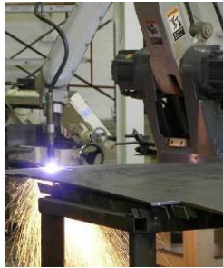
Рисунок 4. Робот для плазменной резке деталей из листового металла по заданной программе

Стоит отметить, что в разные эпохи и в разных отраслях общественного производства закон вытеснения человека из технической системы проявляется по-разному. Но в технологически развитом обществе этот процесс можно назвать вытеснением человека из производственного процесса.