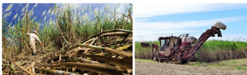
Рисунок 2. Уборка сахарного тростника ручная и машинная

Затем – из системы алгоритмического управления 4 .