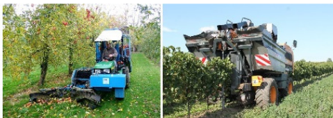
Рисунок 10. Промышленная уборка яблок и винограда

Яблоки, груши или ягоды стряхивают с кустов и деревьев на подложенный брезент, а затем грузят в бункер. Все это обеспечивает высокую производительность.