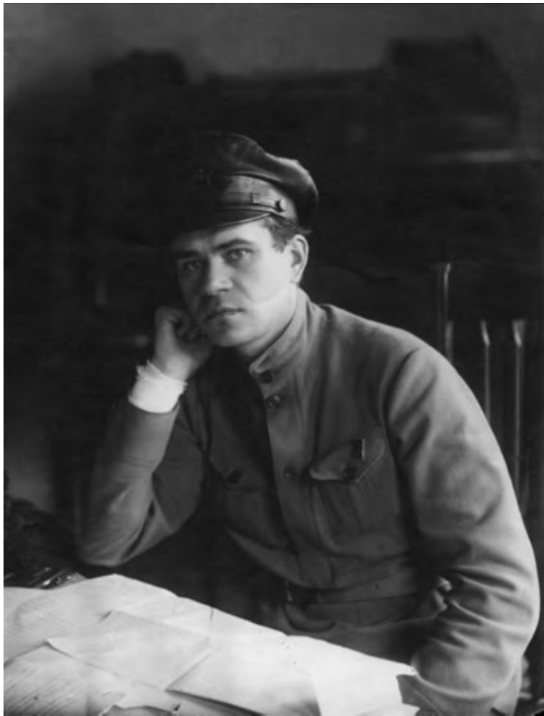
Яков Христофорович Петерс. 1918–1919 гг.