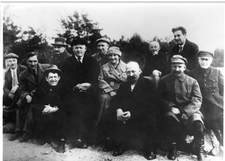
Ф. Э. Дзержинский с группой чекистов и работников ВСНХ. Ленинград. 16 июня 1926 г.