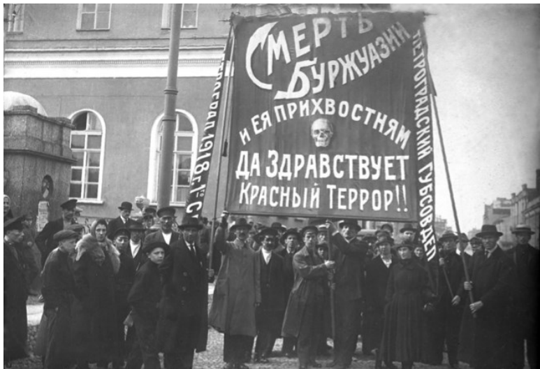
Демонстрация с требованием объявить красный террор против контрреволюции (после покушения на В. И. Ленина). 1918 г.