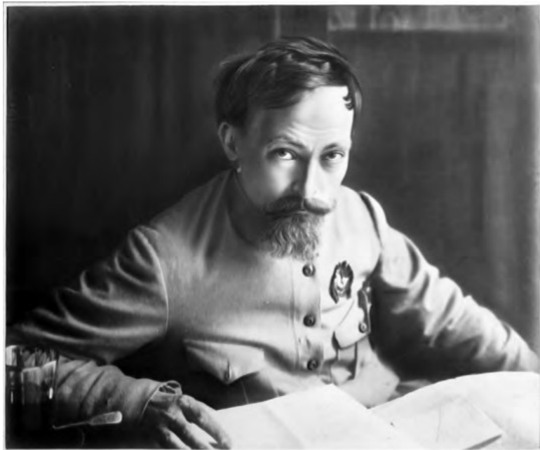
Ф. Э. Дзержинский. Москва. 1919 г.

Выписка из протокола СНК № 21 от 7 декабря 1917 г. о создании ВЧК. Декабрь 1917 г.