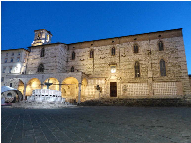
Собор и фонтан.

и красного кирпича, выглядит мрачновато. По выступам на фасаде видно, что его планировали отделать мрамором, но на это у местного епископа и городских властей не хватило средств.