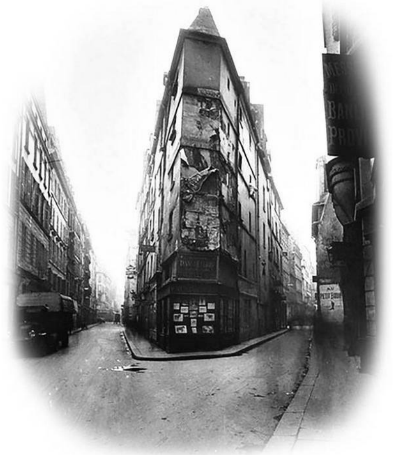
Париж «Отверженных». Справа – Госпитальный бульвар,