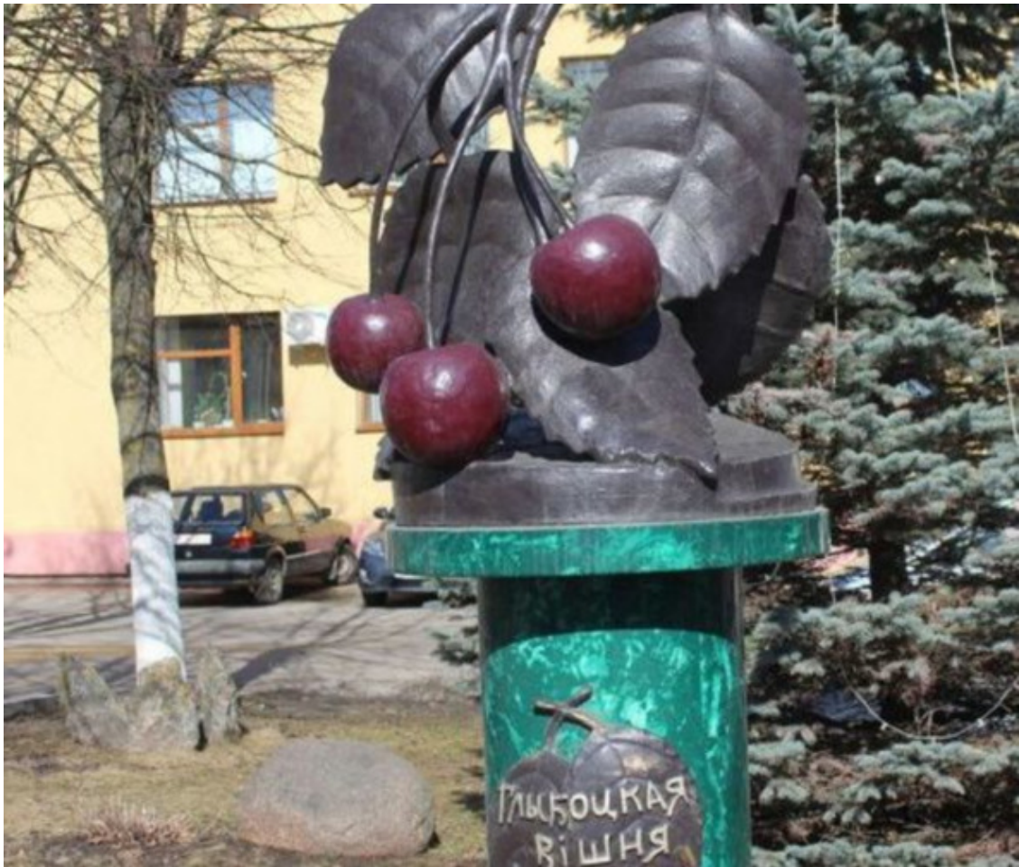
Памятник вишне в Глубоком.

Город Глубокое нередко называют «вишневой столицей» Беларуси. Здесь наблюдается рост вишневых деревьев примерно в 8 дворах из 10! Вот и поставили вкусной и красивой ягоде достойный памятник.