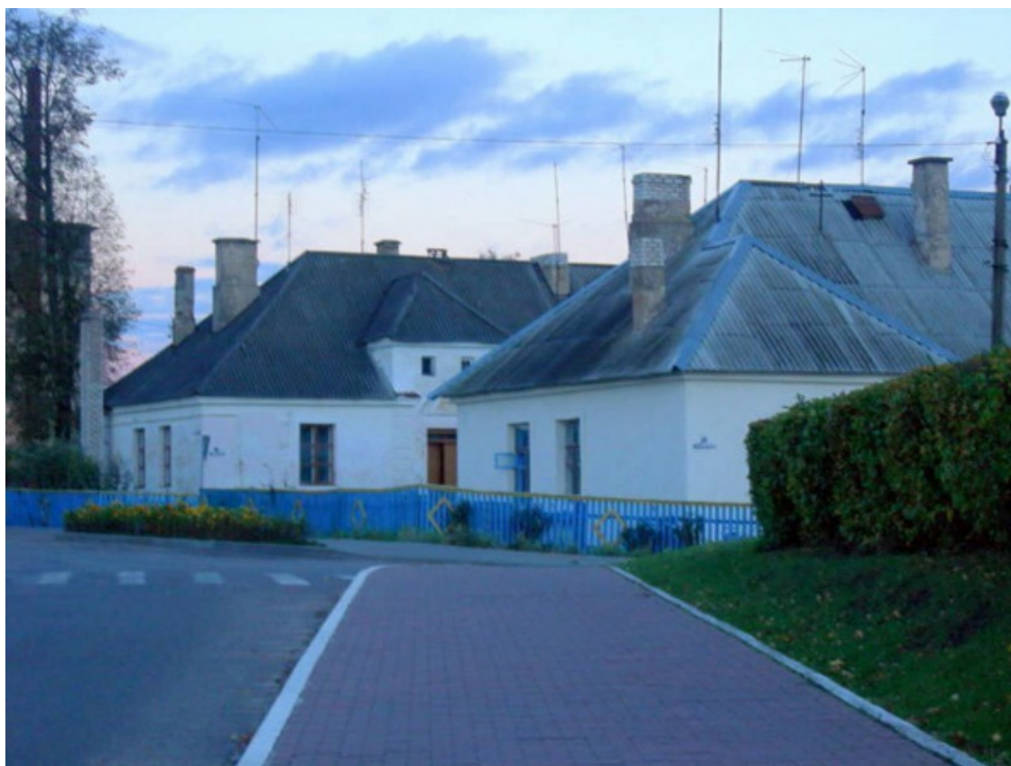
Город Столбцы.

Столбцовщина знаменита имена белорусских поэтов и писателей. Здесь родились Генрих Далидович, Казимир Камейша, Евгений Хвалей, Микола Малявко, Алесь Комаровский».