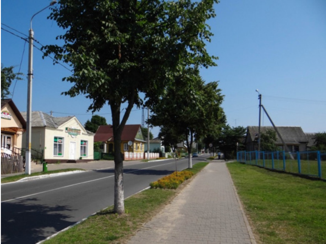
Столбцы. 5—7 июля 2013. sergiofs. Источник: https://sergiofs.livejournal.com/tag/Столбцы

Книга имеет образовательный и культурный характер.