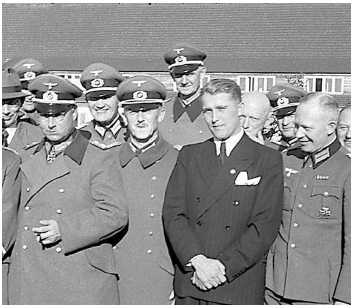
Барон Вернер фон Браун. Ручки крендельком и с трогательным платочком...