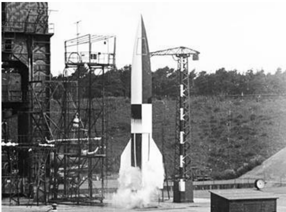
Ракета «Фау-2» на стартовом столе

В течение последующих семи месяцев по целям в Англии немцы выпустили свыше 1 300 этих ракет. Был разрушен ряд городских кварталов, при этом погибло 1 055 человек. На Антверпен за тот же период времени обрушилось 1 265 ракет; чуть больше – на Париж и другие крупные европейские города. Согласно приблизительным оценкам, от ударов «Фау» в Европе погибло 2 724 и было серьезно ранено 6 467 человек. 99 % пострадавших – гражданское население. Военная инфраструктура союзников ущерба не имела вообще.