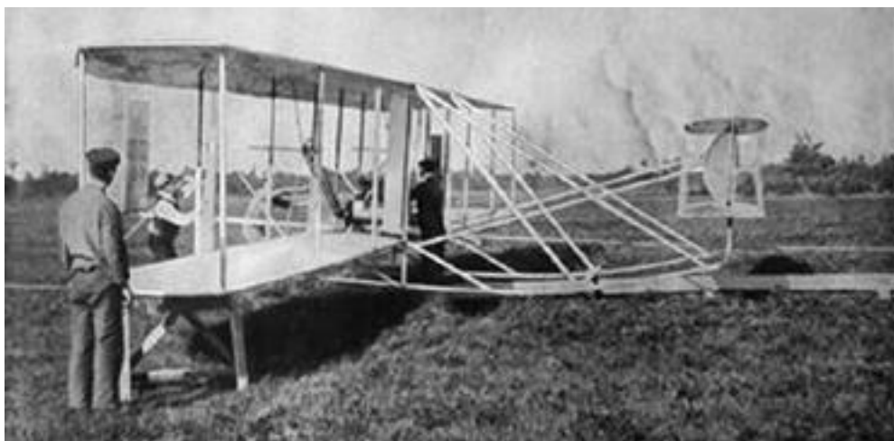
Первый в мире самолет братьев Райт