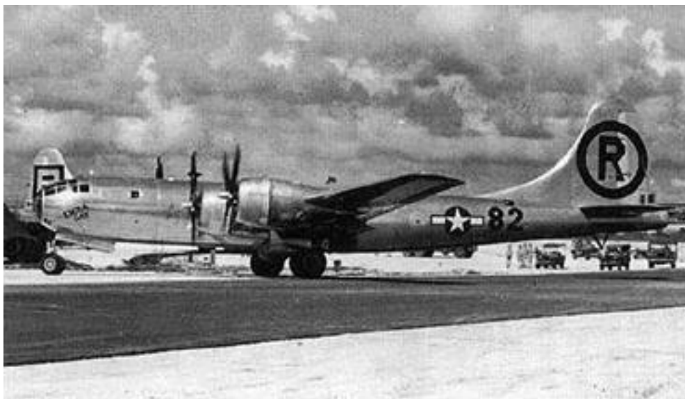
Американский тяжелый бомбардировщик В-29 «Superfortress»