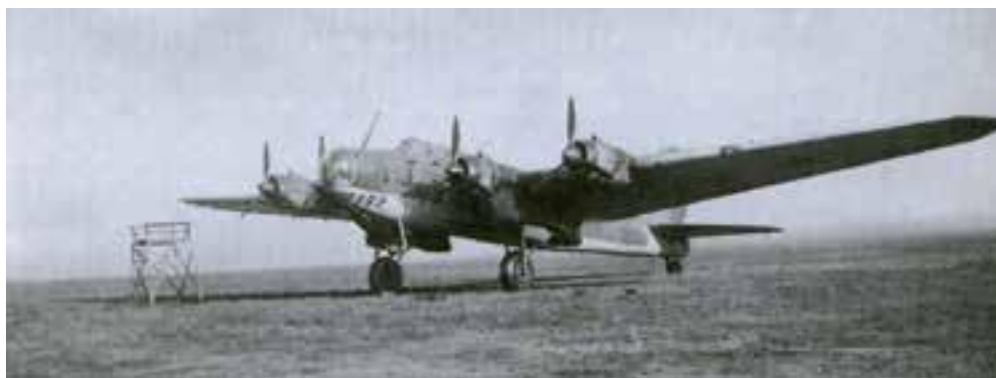
Первый советский стратегический бомбардировщик ТБ-7