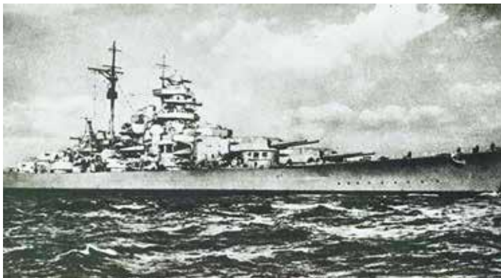
Линкор «Бисмарк»