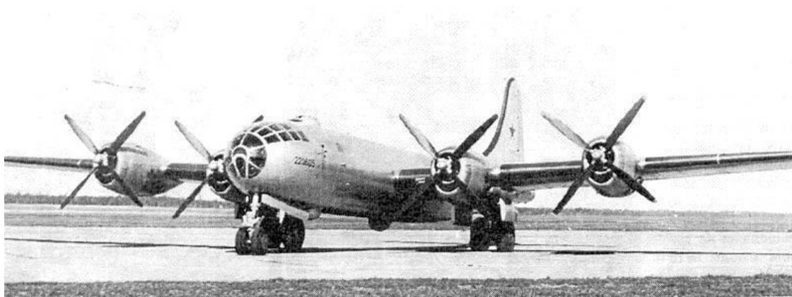
Первый советский стратегический бомбардировщик – носитель ядерного оружия Ту-4. Полная, до последней заклепки, копия американского бомбардировщика Б-29