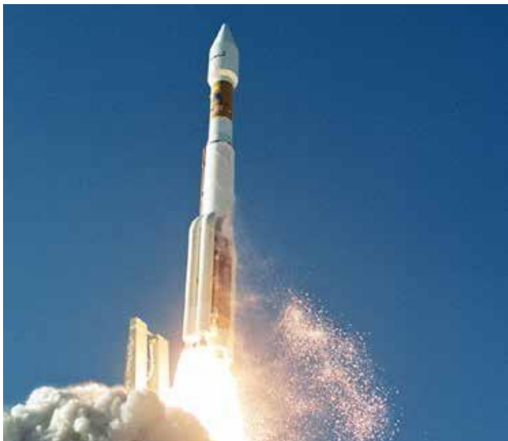
Американская ракета-носитель «Атлас-5»

...В 17:49 по Всемирному координированному времени первого весеннего дня 2017 года с пускового комплекса SLC-3E на базе ВВС Соединенных Штатов Ванденберг в реве российского маршевого двигателя и твердотопливных ускорителей со стартового стола ушла в небеса ракета-носитель «Атлас-5». Под ее головным обтекателем размещался принадлежащий Национальному управлению военно-космической разведки спутник NROL-79. Мартовский запуск был 70-м стартом «Атласа-5» – настоящей американской рабочей лошадки для вывода на орбиту военной полезной нагрузки.