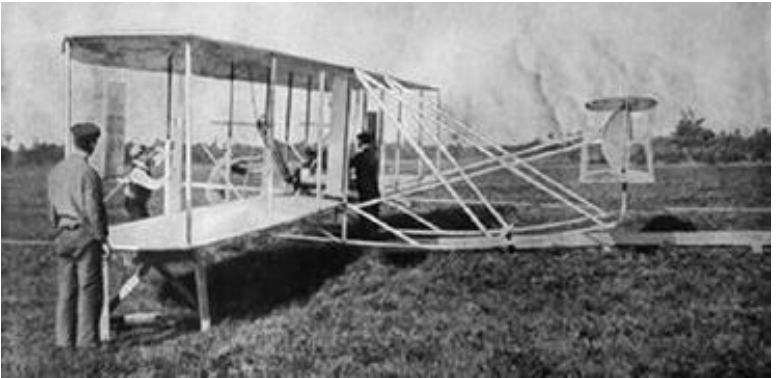
Первый в мире самолет братьев Райт