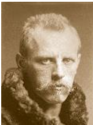
Нансен Фритъоф Ведель-Ярлсберг (1861–1930)