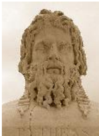
Пифей (ок. 380 – ок. 310 до н. э.)

5 Греческий купец, путешественник, географ, происходивший из греческой колонии Массалии (современный Марсель). Пифей около 325 года до н. э. совершил путешествие вдоль берегов Северной Европы. Книга Пифея «Об океане» с описанием его путешествия до наших дней не дошла, однако на нее ссылаются Страбон, Плиний Старший, Полибий и другие античные авторы, часто чтобы опровергнуть его данные. Пифей плывал вокруг Британии, а также побережья Балтийского моря, на котором добывали янтарь. Британию он описал как треугольный остров и посчитал размеры его сторон (преувеличив их, но пропорции были верны). Он был первым греком, описавшим полярный день, полярное сияние и вечные льды. Споры вокруг острова Туле, находящегося за полярным кругом (по описанию Пифея, полярный день там длится целый месяц), не утихали много веков.