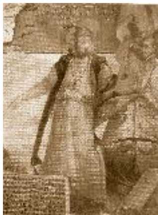
Джон Кабот (1450–1499)

10 Джон Кабот, итальянский мореплаватель и купец на английской службе (настоящее имя Джованни Кабото), впервые исследовавший побережье Канады.