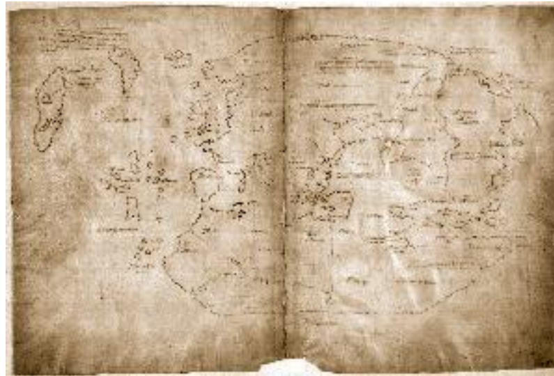
Древний манускрипт – карта Винланда

9 Скорее всего, здесь Й. Лид говорит об островах архипелага Шпицберген. Правда, до сих пор наука окончательно не выяснила, кто первым обнаружил эти острова – русские мореходы или викинги, поэтому и этнический состав населения островов в указанное время был смешанным.