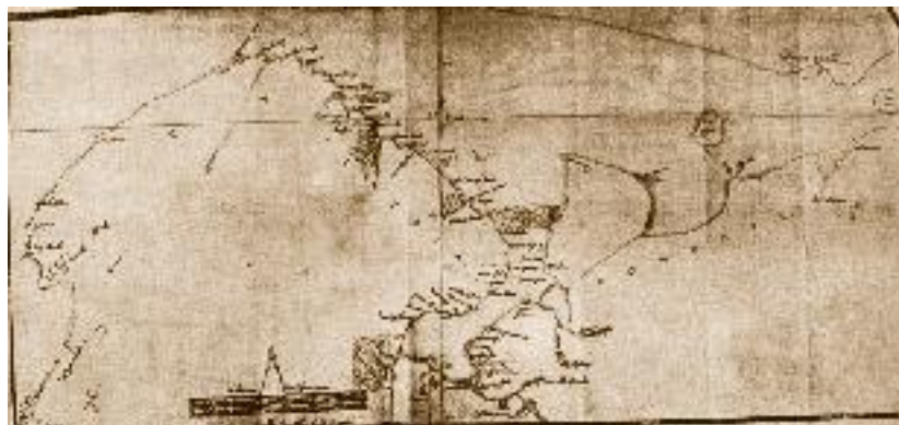
Карта Северного океана (море Баренца) С. Борро из собрания Британского музея

21 Этими русскими лодками были кочи. Коч (другие названия – коча, кочмора, кочмара) – поморское деревянное одномачтовое однопалубное промысловое парусно-гребное судно XI–XVII вв. Кочи первоначально строились без применения металлов. Оснащались мачтой, навесным рулем и веслами. Также известны и двухмачтовые суда. Коч был приспособлен как для плавания в битом льду и в мелкой воде, так и для передвижения волоком. Полагают, что его название произошло от слова «коца»-«ледовая шуба». Так называлась вторая обшивка корпуса, сделанная из прочных дубовых или лиственничных досок в районе переменной ватерлинии. Она предохраняла основную обшивку от повреждений при плавании среди льдов. По археологическим и архивным данным историка и археолога Михаила Белова, особенностью коча был корпус, имевший форму яйца или скорлупы ореха. Благодаря такой форме судно при сжатии льдов не раздавливалось, а просто выжимало на поверхность льдин, и оно могло дрейфовать вместе с ними.