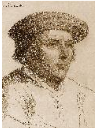
Ричард Ченслер (?-1556)

16 Здесь Й. Лид приводит несколько неточную информацию. Р. Ченслер пристал к берегу в бухте св. Николая, где был тогда Николо-Карельский монастырь, впоследствии же там был основан город Северодвинск, а не Архангельск. Интересно, что одна из улиц города Северодвинска на севере острова Ягры носит имя Ричарда Ченслера.