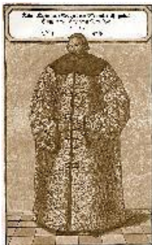
С. фон Герберштейн в кафтане, пожалованном ему великим князем московским Василием III Ивановичем в 1517 г.

Дважды посетил Московию: в 1517 г. выступал посредником в мирных переговорах Москвы и Литвы, а в 1526 г – в возобновлении договора 1522 г. Продолжительность этих визитов (9 месяцев в 1517 г.) позволила ему изучить действительность во многом загадочного тогда для европейцев Московского государства. Наибольшую известность ему принесла книга «Записки о Московии», изданная 1 марта 1549 г., где достоверная информация перемешивается с явным вымыслом. Тем не менее данная книга долгое время для европейцев была одним из основных источников информации о Русском государстве XVI в.