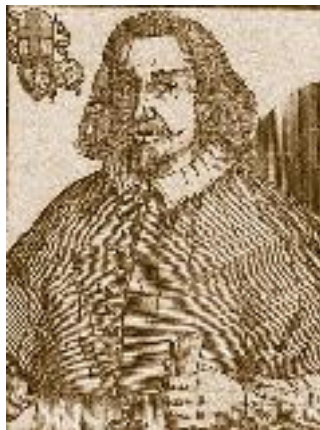
Олаус Магнус (1490–1557)

«Картой», в ней присутствуют его собственные воспоминания о поездках, легенды, фольклор, этнографические сведения, фрагменты классических трудов Саксона Грамматика и других.