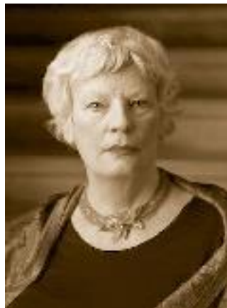
Веренишёлль Марит, профессор истории и искусствознания университета г. Осло