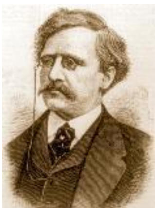
Норденшюльд Нильс Адольф Эрик (1832–1901)