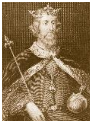
Альфред Великий (849–899/901), король Уэссекса с 871 г.

3 При Альфреде Великом произошла консолидация англосаксонских королевств вокруг Уэссекса. В результате упорной борьбы с датчанами Альфред Великий около 886 г. получил власть над юго-западной частью Англии.