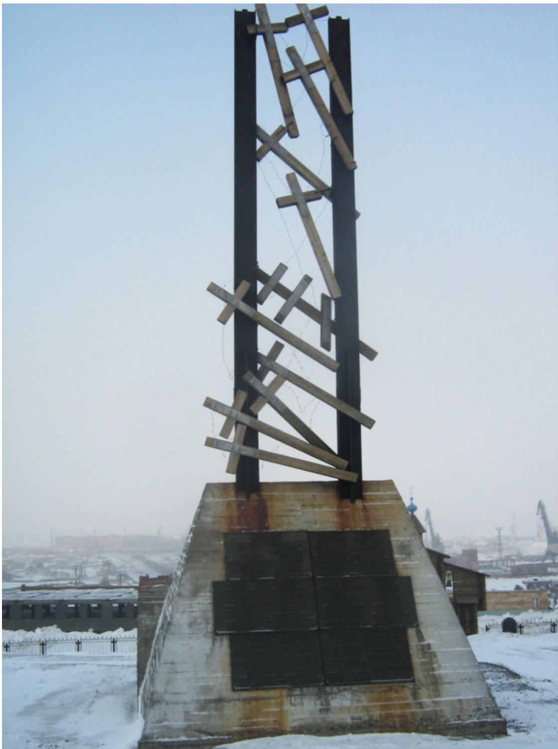
Один из памятников мемориала «Норильская Голгофа».