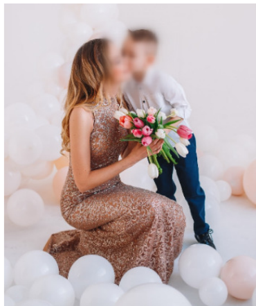
Рис. 1 Это ни картинка с лицами, в нём чувство приятия. сынишки