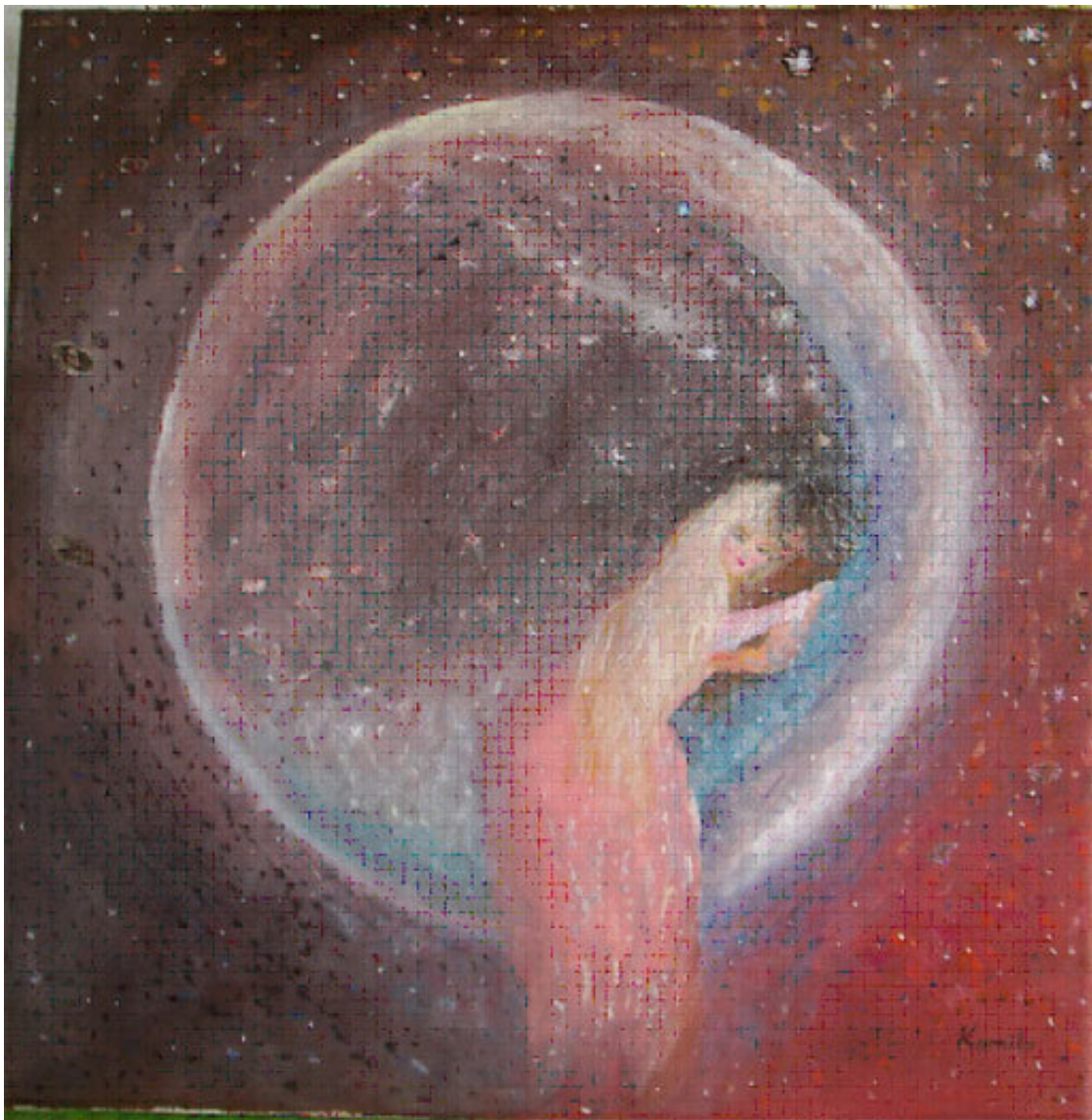
Картина «Летняя ночь» – автор Людмила Коура (КоМила).