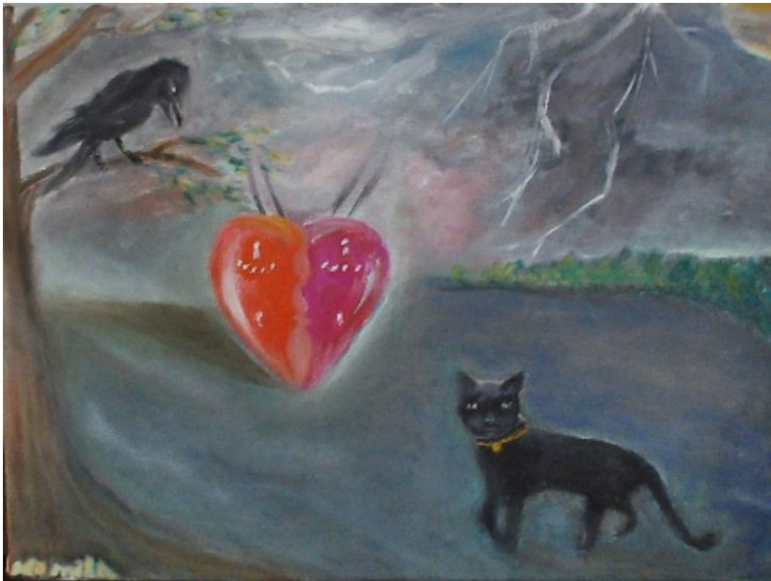
Картина «Чёрный Кот» – автор Людмила Кочура (КоМила)