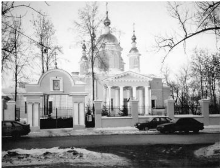
Введенская церковь. Современный вид

читал, но был так мал, что ему к аналою подставляли скамеечку. Однажды прихожане увидели, как маленький мальчик входит в алтарь через Царские Врата – все усмотрели в этом указание на будущее служение у Престола Божия.