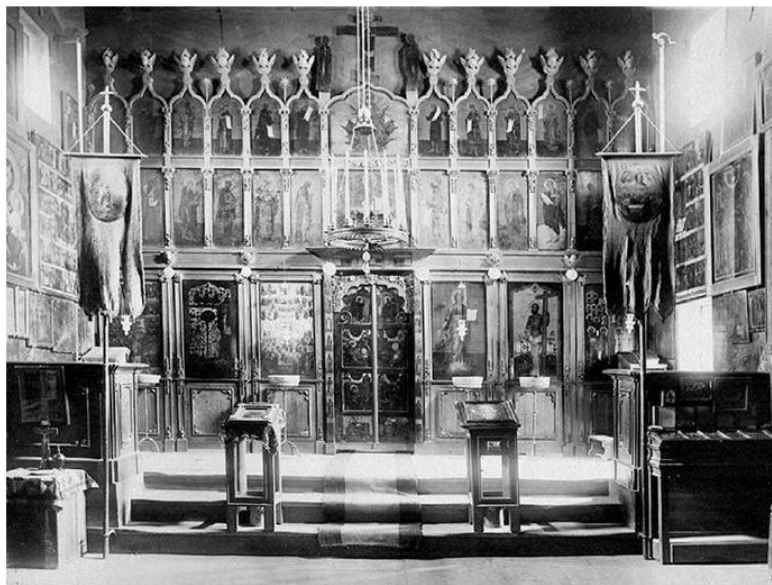
Иконостас Успенской церкви Гетсиманского скита

добного: «Стяжание Духа Святаго». Принимая имя Святого, монах вручает себя его водительству. И когда после пострига к новопостриженному подходили монахи, спрашивая: «Что ты есть имя, брате?» – в ответ звучало: «Серафим». Это было начало пути.