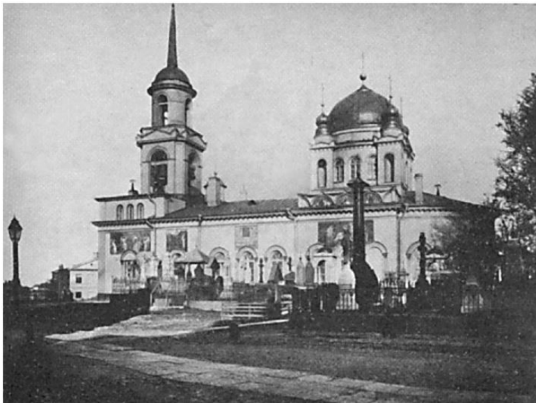
Единоверческая Благовещенская церковь на Волковом кладбище