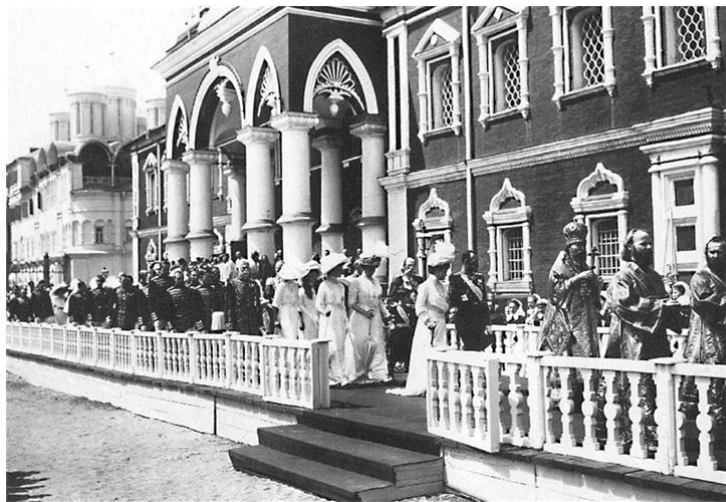
Чудов монастырь. Приезд Императорской Семьи. Впере-